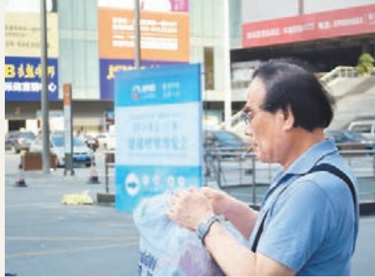
昨日舉行的亞太健康呼吸博覽會主題之一是控煙,不過,有參會市民在會場入口吸煙。