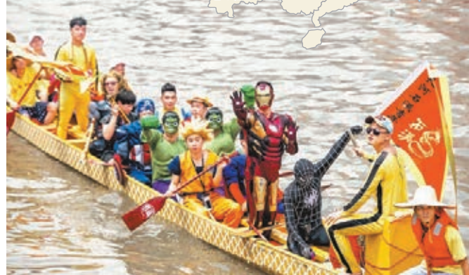
昨日在廣州市車陂村舉行的端午龍舟勝景活動中,「復仇者聯盟」的「英雄們」在龍舟上揮手致意。