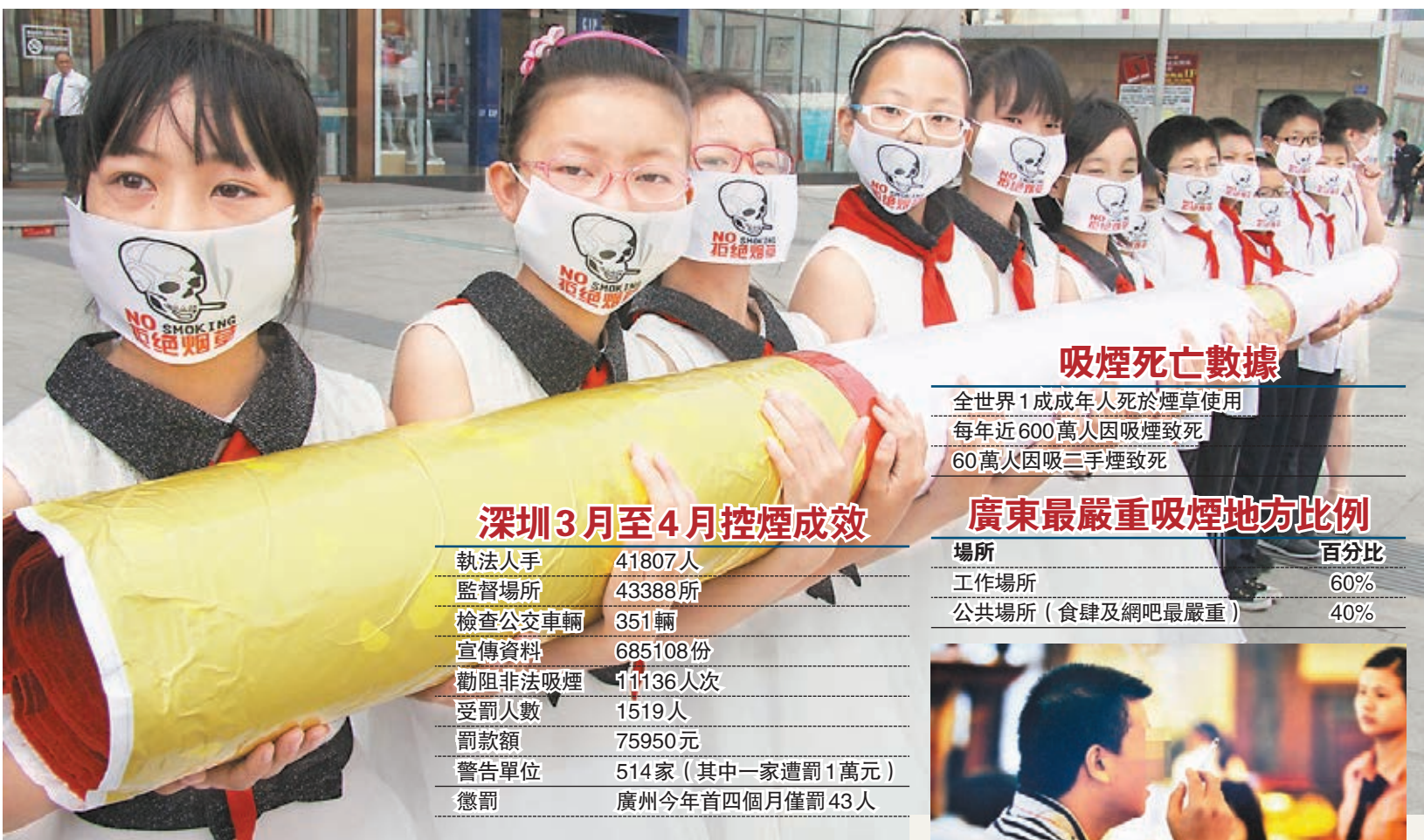
安徽合肥江淮學校的小學生在街頭宣傳禁煙。

對於控煙效果不明顯的現狀,中國工程院院士鍾南山在參加無煙日前夕舉行的亞太健康呼吸博覽會時指出,現在中國的控煙單位和香煙銷售推廣單位都是工信部,一個部門又賣煙又控煙,這種設置顯然並不合理。「據我了解,歐美國家的控煙工作都是由衛生部門開展的。」鍾南山建議,控制吸煙工作應該由衛生部門來推廣,進行更為有效的「吸煙有害健康」的宣傳。