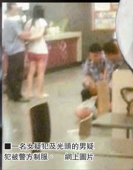
一名女疑兇及光頭的男疑兇被警方制服。網上圖片