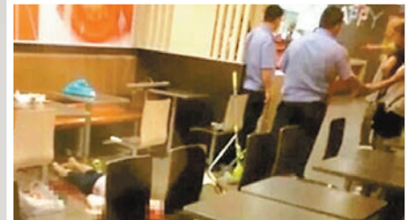
3. 受害女子倒臥血泊,警察封鎖現場。