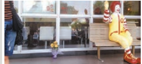
當地人在案發現場的麥當勞外放置鮮花悼念死者。