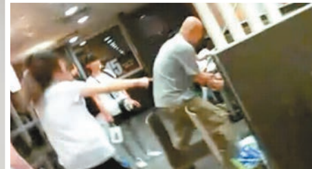
2. 光頭男大罵女子,持鋼拖把毒打。