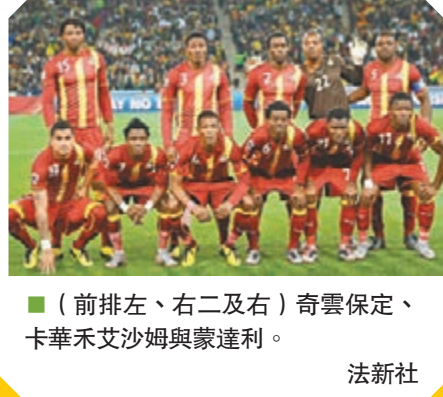
■(前排左、右二及右)奇雲保定、卡華禾艾沙姆與蒙達利。

加納小檔案 主教練: 艾比亞 焦點球星: 蒙達利、奇雲保定、艾辛、卡華禾艾沙姆 最新世界排名: 38 世界盃最佳成績: 2010年8強 攻力(最高5★): ★★★★★ 守力(最高5★): ★★★★★