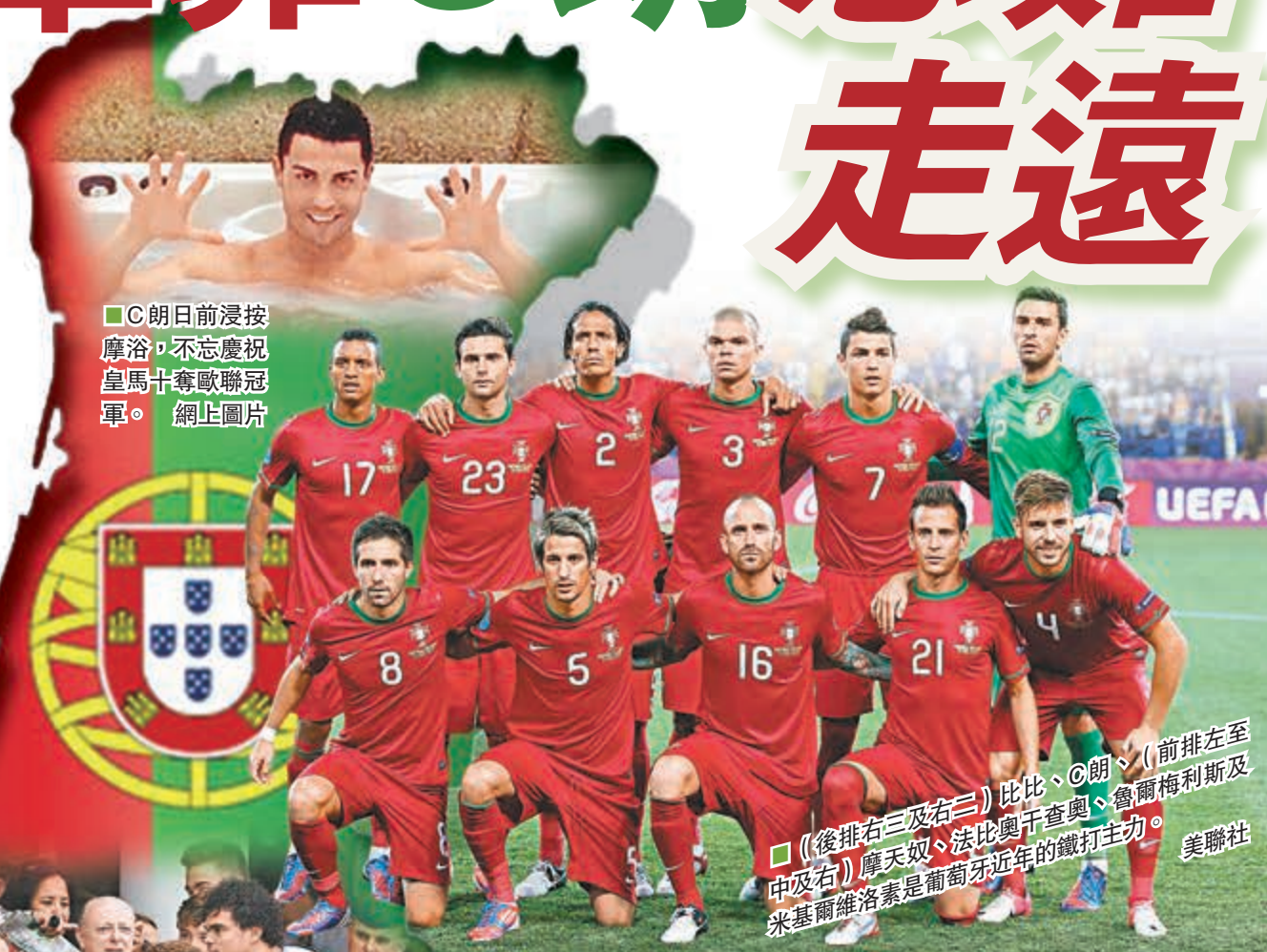
■C朗日前浸按按摩浴, 不忘慶祝皇馬十奪歐聯冠軍。