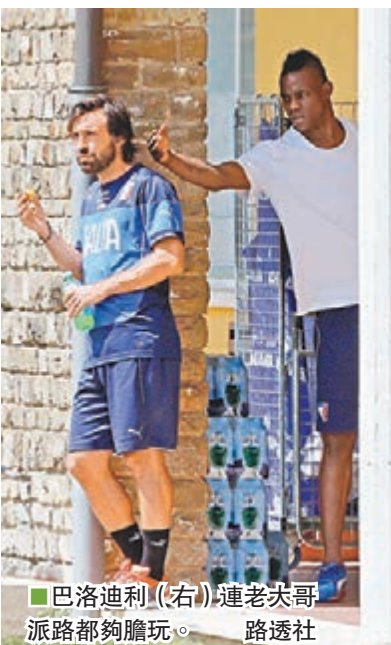
■巴洛迪利(右)連老夫哥派路都夠膽玩。