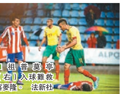
■祖普莫寧(右)入球難救喀麥隆。

2011年以伊度奧為首不滿總獎金而罷訓的喀麥隆又可能歷史重演, 據悉喀足總今屆世盃獎金為每名球員提供跟上屆差不多的3.7萬歐元獎金, 但以伊度奧為首的球員又不滿, 恐鬧罷訓。