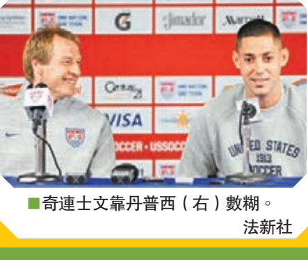
■奇連士文靠丹普西(右)數糊。

美國隊小檔案 主教練: 奇連士文 焦點球星: 丹普西、侯活 最新世界排名: 14 世界盃最佳成績: 1930年準決賽 攻力(最高5★): ★★★★★ 守力(最高5★): ★★★★★