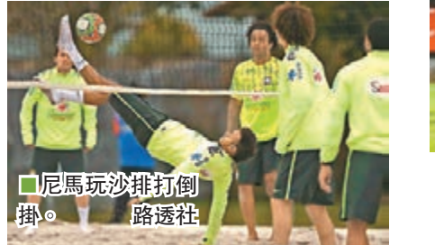
■尼馬玩沙排打倒掛。 路透社

高盛估巴西贏阿根廷奪冠 投資大行高盛日前出了分析研究報告, 預測今屆世盃東道主巴西最終會擊敗宿敵阿根廷奪冠。巴西日前沙灘練波, 射手尼馬表演倒掛。但後衛馬些路心情甚差, 有記者問巴西近年無人膺足球先生, 他憤怒地回應巴西大球星, 行入選23人的也撈得風生水起。