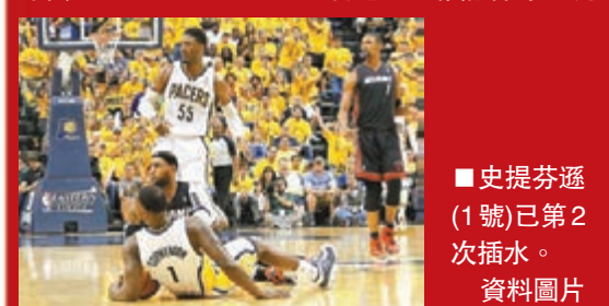
史提芬遜(1號)已第2次插水。資料圖片

溜馬後衛史提芬遜與中鋒希拔日前在第5場東岸決賽「插水」,結果分別被聯盟罰款1萬美元和5千美元。史提芬遜曾在第2仗因插水被罰款5千美元,根據賽例,每多一次插水將會增加5千美元,如達到5次或以上,將被聯盟罰款更大金額或判處停賽。