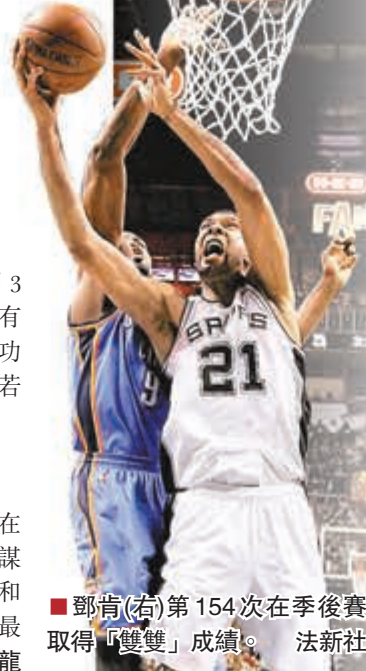
鄧肯(右)第154次在季後賽取得「雙雙」成績。

雷霆在主場連贏2場後,今仗作客打回原形,杜蘭特及韋斯布魯克即使分別攻進25分和21分,可是趕及復出的前鋒伊巴卡失準,只得6分和2個籃板球,雷霆主帥布魯克斯無奈地說:「他的表現明顯不及對上2場,射失了平常會投進的球,但全隊也是這樣。」雷霆是役只得3人得分上雙,投射命中率被限制至只有43.2%。