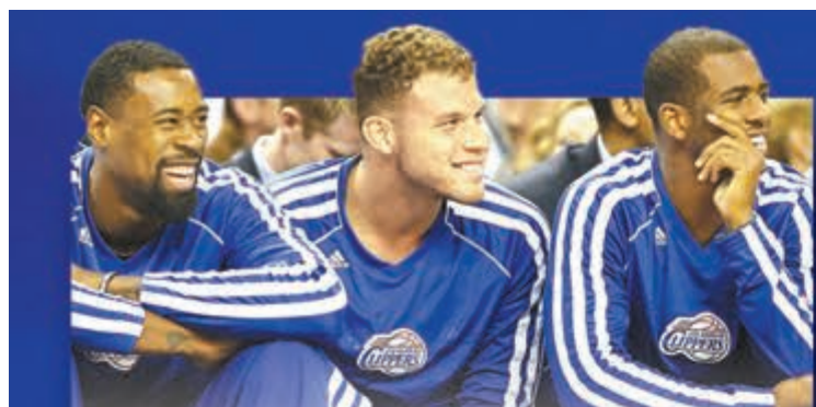
快艇球員勢將迎來新班主。

快艇班主斯特林因種族歧視言論風波被迫出售球隊,昨日有指已簽署同意書賣給微軟前CEO鮑爾默,據報最終作價高達20億美元(約156億港元),打破NBA歷來最高的球隊轉讓紀錄,現只欠聯盟首肯。