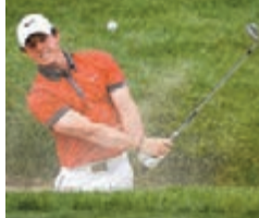
麥基爾羅伊越戰越勇。