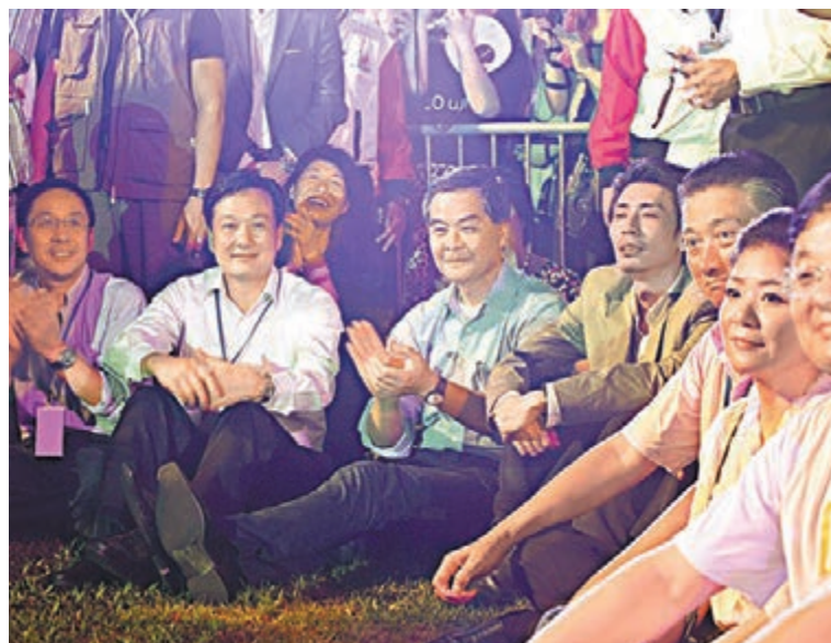
梁振英、林武及一眾嘉賓席地而坐,欣賞表演。

晚上7時許,著名鋼琴演奏家李雲迪登場,一曲《貝多芬熱情第三樂章》開始了音樂節的第二部分「Let's Music HK」。謝安琪、趙雷、茜拉、姚貝娜、泳兒、張靚穎等歌手輪番登場,隨着一首首耳熟能詳的歌曲響起,現場氣氛逐漸推向高潮,觀眾們情緒高漲至極點。