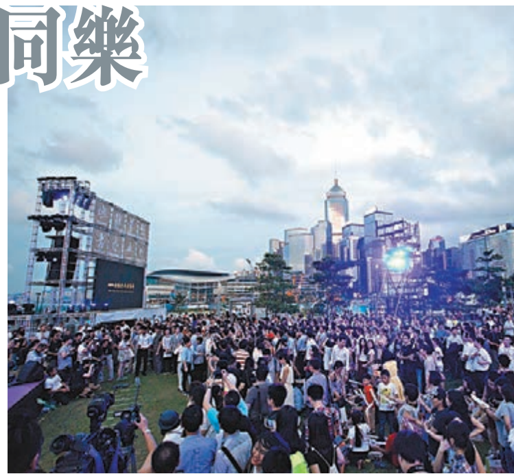
2014香港青年音樂節啟動禮,梁振英、中聯辦副主任林武、中聯辦青年工作部部長陳林、中聯辦機關工作部部長韓淑霞、民政務局局長許曉暉、教育局常務秘書謝潔潔等主禮。