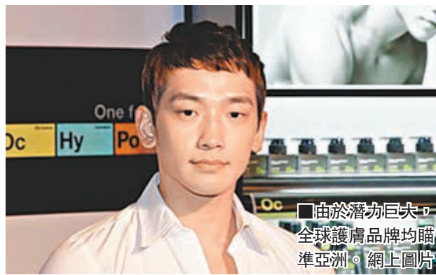
由於潛力巨大，全球護膚品牌均瞄準亞洲。網上圖片

如今男性採護膚品愈來愈普遍，亞洲更是全球男士護膚品增長最快的市場之一，其中包括香港在內的中國地區是最大市場。由於潛力巨大，全球護膚品牌均瞄準亞洲，但有業界人士稱，在亞洲推廣男性護膚品，主要障礙是百貨商店並不具備真正男性化環境。