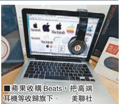
蘋果收購Beats，把高端耳機等收歸旗下。

Vivendi SA旗下Interscope Records董事長，全職為蘋果工作。 蘋果行政總裁庫克表示，音樂是所有人生活中如此重要的一部分，而且在蘋果核心佔有特殊地位。分析認為，這宗收購吸納兩大明星人物及一個新的獨立品牌，反映庫克有意擺脫已故創辦人喬布斯的陰影，建立個人新作風。