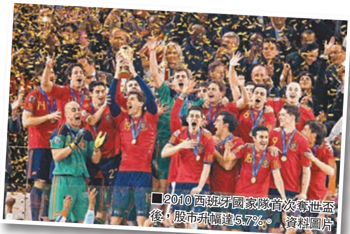
2010年西班牙國家隊首次奪世盃後，股市升幅達5.7%。