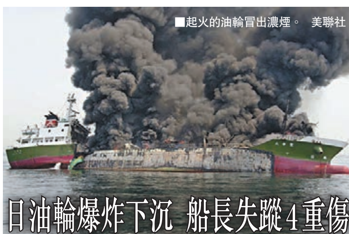
起火的油輪冒出濃煙。