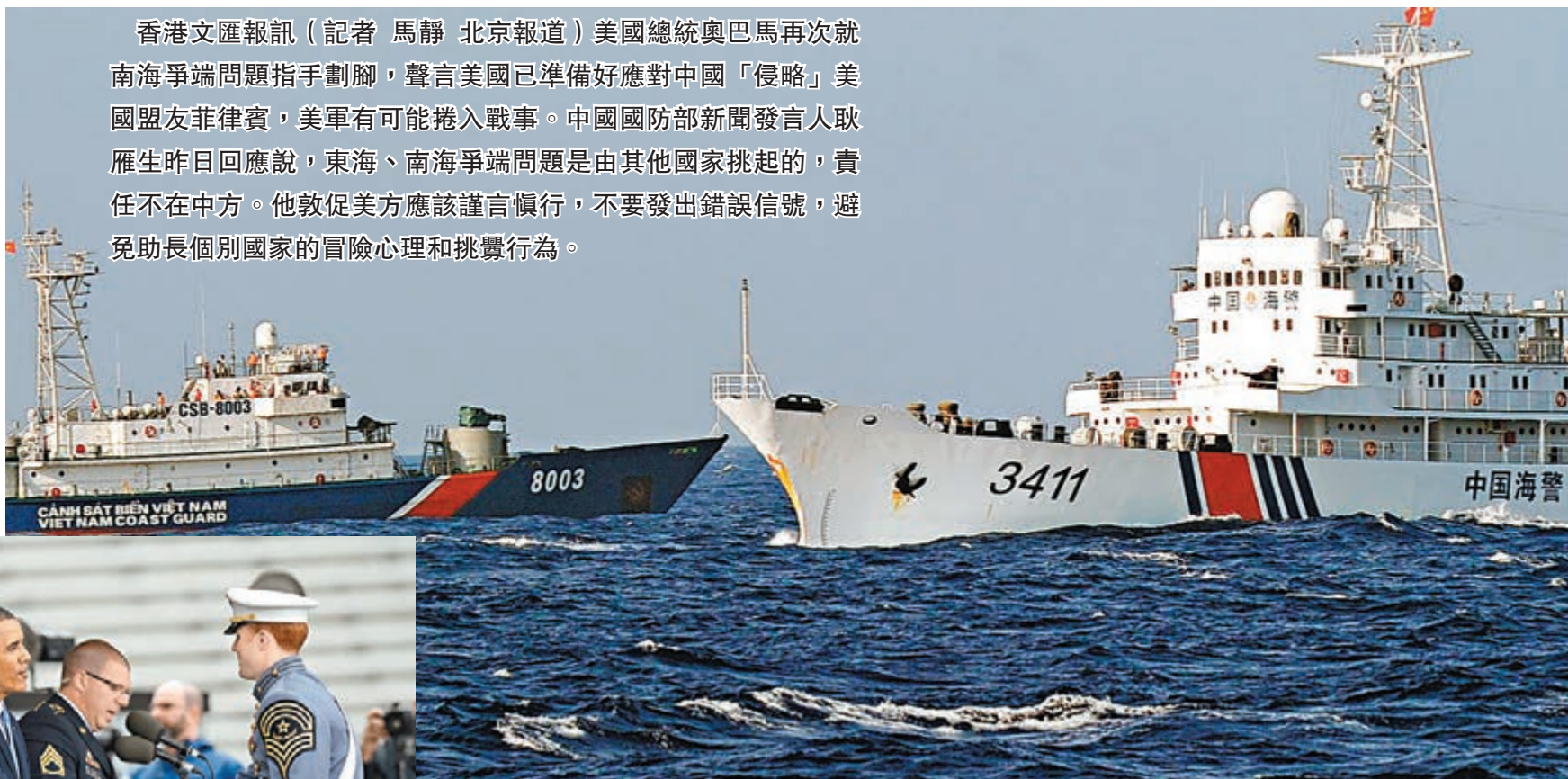
越南海警船(左)月中干擾中國鑽油台作業，被中國海警船(右)驅逐。

耿雁生還在例會中表示，中國軍隊已經在管轄海域建立了常態化戰備巡邏制度，將按照國家統一部署，堅決履行維護領土主權和海洋權益的職責。