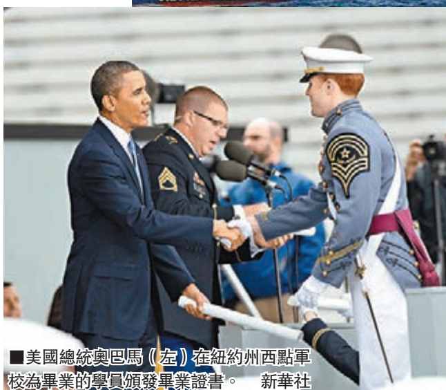
美國總統奧巴馬(左)在紐約州西點軍校為畢業的學員頒發畢業證書。

中國與周邊國家爭議不斷，外界認為中國與周邊國家「擦槍走火」可能性增大。耿雁生稱，不同意這樣的說法。他說，中方奉行與鄰為善、以鄰為伴的周