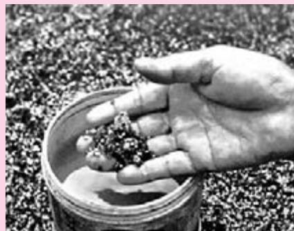
清洗後的紅寶石粗料。