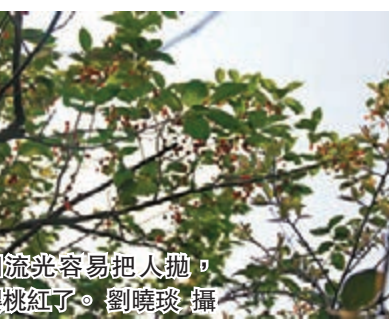
流光容易把人拋，櫻桃紅了。

駛過環山公路，終點定為青島嶗山沙子口的藥用植物園。這是今年第一次品嚐櫻桃，初進果園就急不可耐的摘下一顆送入口中，細品其滋味，圓潤嬌小，卻酸甜可口，琥珀一般的玲瓏，真真讓人愛不釋手。為了摘到高處的櫻桃，記者更是踩着板凳，晃晃悠悠的去夠取，卻又不敢使大勁掰過樹枝，一是為櫻桃樹明年的持續結果，但更是因為櫻桃搖搖欲墜的模樣讓人煞是憐愛，就怕一不小心將櫻桃抖落在地。午後的日光溫暖的撒在林間，一粒粒果實閃耀着點點光芒，像一粒粒紅寶石一般三三兩兩的垂下，尤其是那些黃中帶紅的櫻桃，就藏在稀疏的葉子下，圓鼓鼓的果肉從遠處看就像一顆顆圓潤的金色珍珠。初夏轉瞬即逝，古人言，流光容易把人拋，紅了櫻桃，綠了芭蕉，想起妮維雅的那個