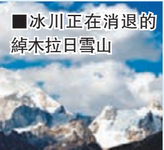
冰川正在消退的綿木拉日雪山