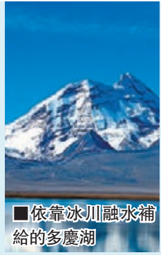
依靠冰川融水補給的多慶湖

據知，從中國科學院青藏高原研究所獲悉，長期的遙感及地面觀測顯示：過去約30年間，青藏高原及其相鄰地區的冰川面積由5.3萬平方公里縮減至4.5萬平方公里，退縮了15%。中國有46,000多條冰川，主要分佈在青藏高原。冰川消融短期內會造成江河流域水量增加，長此以往，一旦部分冰川消亡或冰川面積減少，其下游徑流就會逐漸減少，影響社會經濟可持續發展。