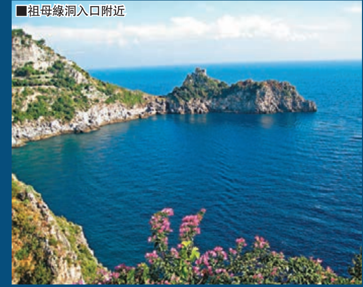
祖母綠洞入口附近