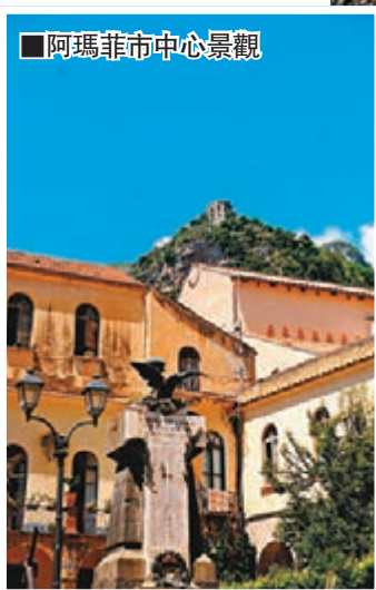
阿瑪菲市中心景觀

你還可以從阿瑪菲海岸看薩雷諾灣，薩雷諾灣是位於意大利南部坎帕尼亞大區薩雷諾省沿岸，第勒尼安海的一個海灣。薩雷諾灣的北岸是旅遊熱點地區阿瑪菲海岸，包括阿瑪菲、米諾利、波西塔諾等城鎮以及薩雷諾市本身。薩雷諾更是意大利坎帕尼亞的第二大城市、薩雷諾省省會，位於第勒尼安海薩雷諾灣畔。