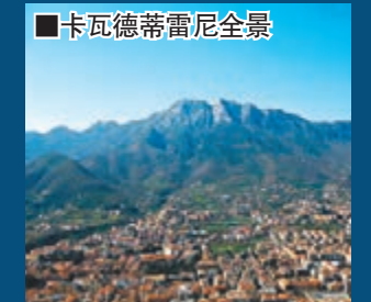
卡瓦德蒂雷尼全景