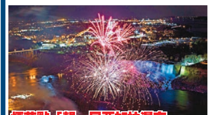
煙花點「靚」尼亞加拉瀑布