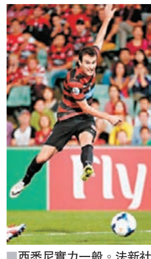
西悉尼實力一般。

此外，納比近日在接受意大利媒體採訪時表示，在中國執教挺美好，即使中國缺乏真正的足球文化，沒有足球傳統，孩子們也不踢球。納比還表示，中國在球會層面還不錯，但國家隊層面依然遠遠落後，中國足球還需要很多年的發展。