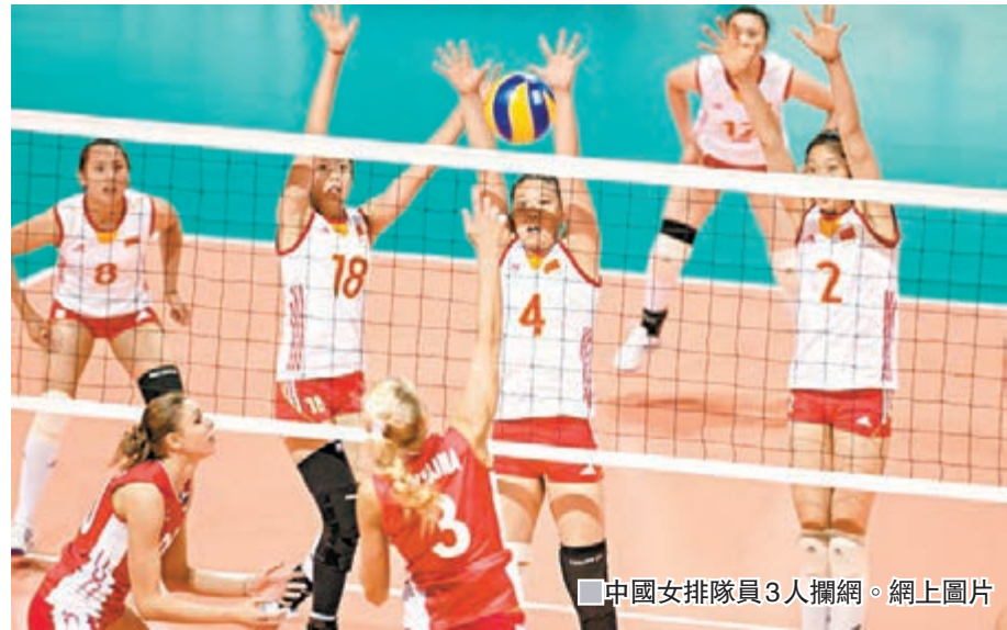
中國女排隊員3人攔網。