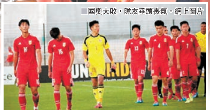
國奧大敗，隊友垂頭喪氣。

經歷了1:1打和法國、3:3和智利的兩場比賽之後，中國國奧隊昨日在土倫盃上迎來了第3個對手、葡萄牙青年隊。面對整體實力明顯強於自己的對手，國奧隊在比賽之中多次出現失誤，幾乎每一次失誤都被對手抓住機會破門得分，最終國奧隊以1:4的大比分負於葡萄牙隊，遭遇本次土倫盃的第一場失利。