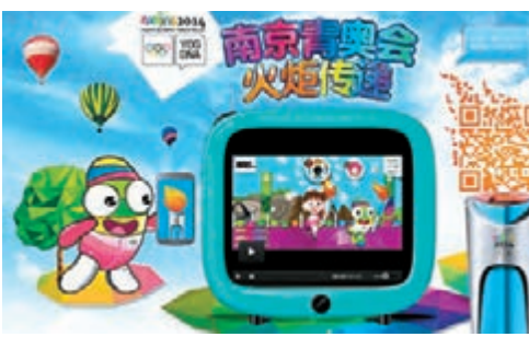
南京青奧官網宣傳網絡火炬傳遞。網上圖片

中新社南京28日電 「截至今天，網絡火炬也已經傳過了80個國家和地區，網絡火炬傳遞用戶達到了200萬人次，全球網絡人氣指數超過了2200萬，使用手機APP客戶端碰碰聖火近萬次。」28日，南京市2014青奧會組委會宣佈。