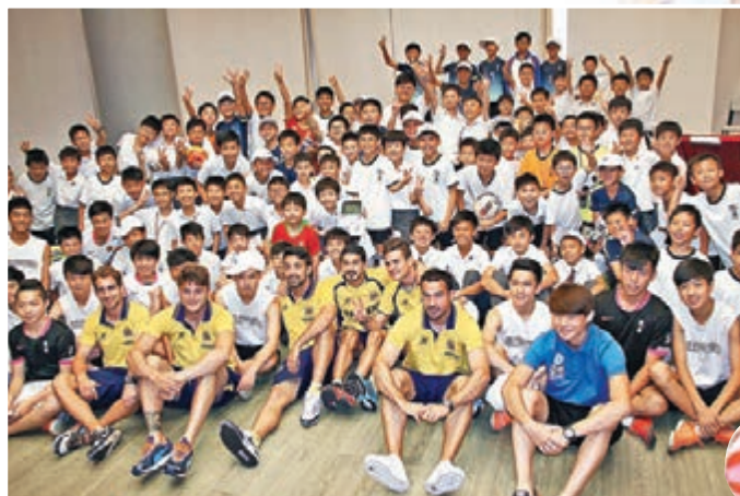
維拉利爾6名球星昨日到訪男拔小。