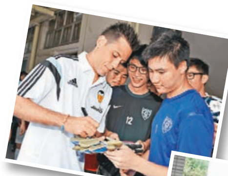
迪亞高艾維斯(左)為學生簽名。