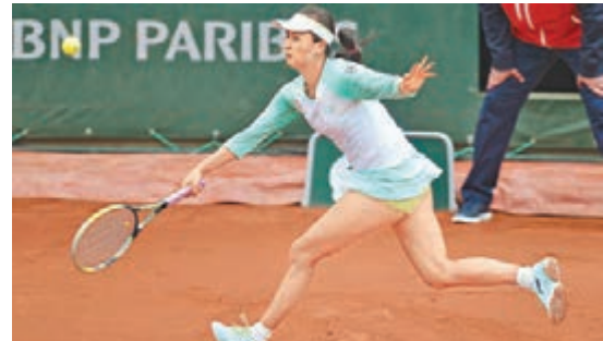
彭帥以總盤數0:2不敵美國球手史提芬絲出局。