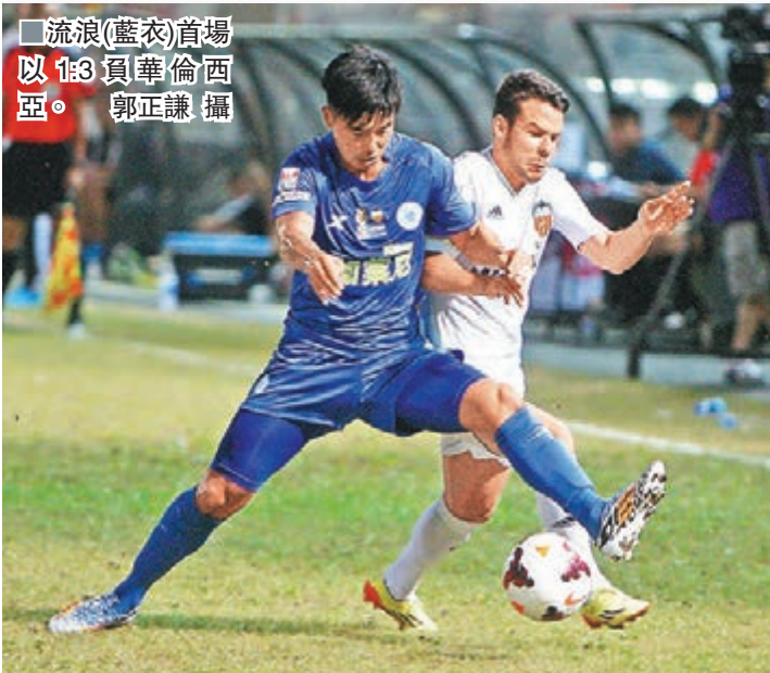
流浪(藍衣)首場以1:3負華倫西亞。