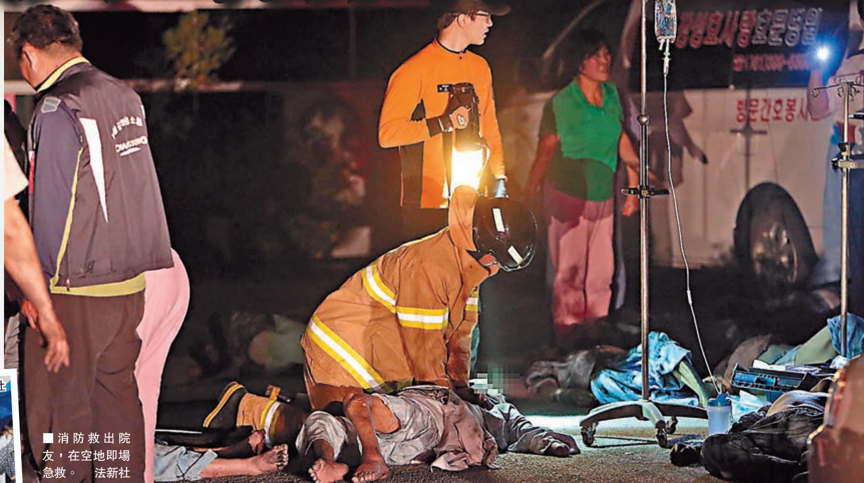
消防救出院友，在空地即場急救。