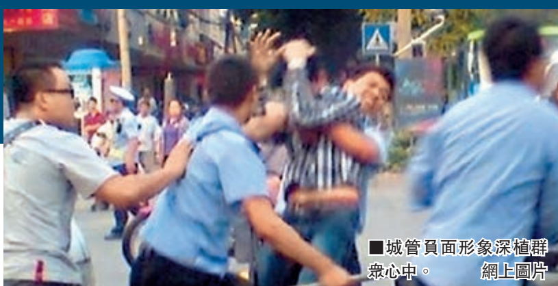
城管負面形象深植群眾心中。網上圖片