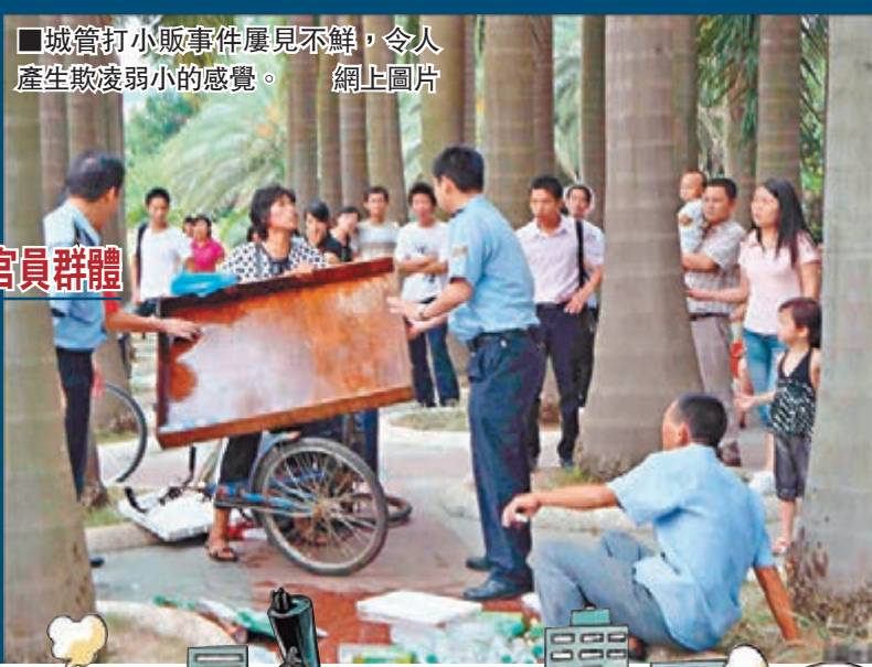
城管打小販事件屢見不鮮，令人產生欺壓弱小的感覺。網上圖片

調查還從群眾對官員的偏好進行了排名。排名顯示，當前群眾「愛才喜惠」，因此官員形象需「才德兼備」。而無論是「能力」型官員還是「惠民」型官員均屬於實務型官員，說明群眾最為期待的是官員專注於實事，真正讓社會獲益。