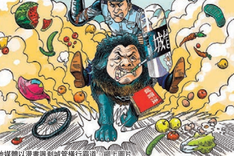
內地媒體以漫畫諷刺城管橫行霸道。網上圖片