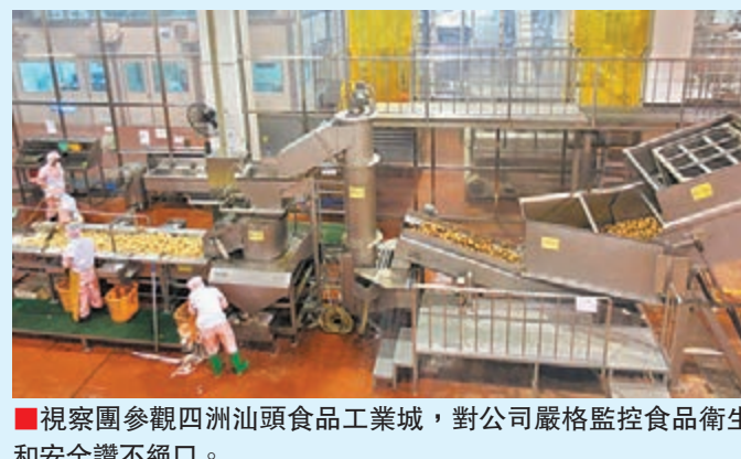
■視察團參觀四洲汕頭食品工業城，對公司嚴格監控食品衛生和安全讚不絕口。