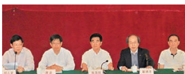
■汕頭視察結束前舉辦「省政協香港地區委員專題視察意見反饋會」，左起為汕頭市長鄭人豪、省政協副主席唐豪、汕頭市委書記陳茂輝、全國政協常委戴德豐、市政協主席郭大欽出席大會。

視察團還專程到華僑公園瞻仰莊世平先生塑像，並向莊世平先生塑像獻花。視察活動結束前，視察團在副團長黃順源投資的帝豪酒店召開意見反饋會，汕頭市委書記陳茂輝，市長鄭人豪，市政協主席郭大欽等領導出席。