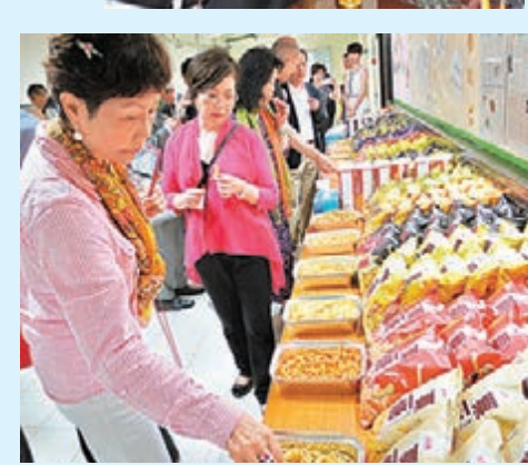
■視察團參觀四洲汕頭食品工業城，集團擺放各種食品接待團員。