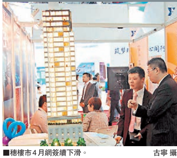
穗樓市4月網簽續下滑。

報告顯示,新建商品住宅網上簽約均價每平方米達15,443元(人民幣,下同),比今年3月略漲1.5%,再刷新歷史新高。