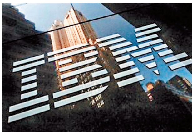
■中國呼籲銀行棄用IBM伺服器。

香港文匯報訊 一場中美諜戰戰雲愈烈!自美國司法部對5名中國解放軍人員提出網絡商業竊密起訴後,昨日中國又再展開升級報復,呼籲內地銀行放棄IBM公司開發的高端伺服器,轉用本土品牌。上周,中國連續打響報復「三槍」,先宣佈對所有外國的資訊科技產品和服務進行新安檢,任何不能通過檢查的產品或公司一律禁售,繼而禁止中國機關使用Win8系統;其後再下令國有企業與美顧問公司斷絕關係。