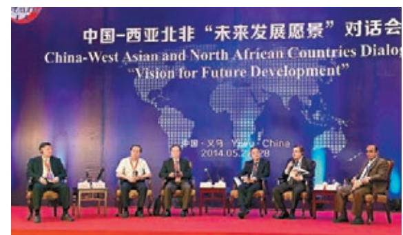
■與會的西亞北非各國政要對中國「新絲綢之路」充滿期盼。

香港文匯報訊(記者白林森義烏報道)來自西亞北非地區22個國家政要及駐華使節昨日相聚素有「世界超市」之稱的浙江義烏市,在此進行中國—西亞北非未來發展願景對話。全國政協副主席馬曉、蘇丹副總統哈賽卜、土耳其大國民議會副議長雅庫特等均認為,中國提出並積極倡導的「絲綢之路經濟帶」和「21世紀海上絲綢之路」戰略是個偉大的構想,完全符合各方未來發展願景,必將有力地促進各方共同繁榮。