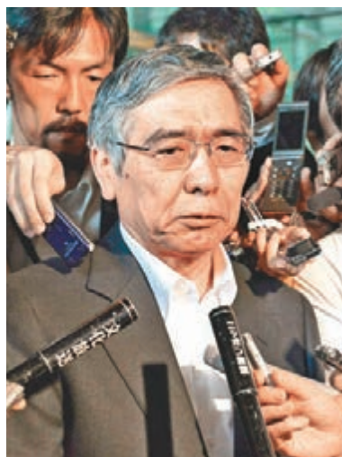
日本央行行長黑田東彥上周「出口術」打壓日圓升勢。

高，自2000年起稍高於15%的年率化漲幅，比歐美日等地高息股的6.5%至9%不等年率化漲幅來得吸引，現在歐美景氣緩步復甦，有望讓日本除外亞太的高息股板塊，成為市場投資關注焦點。