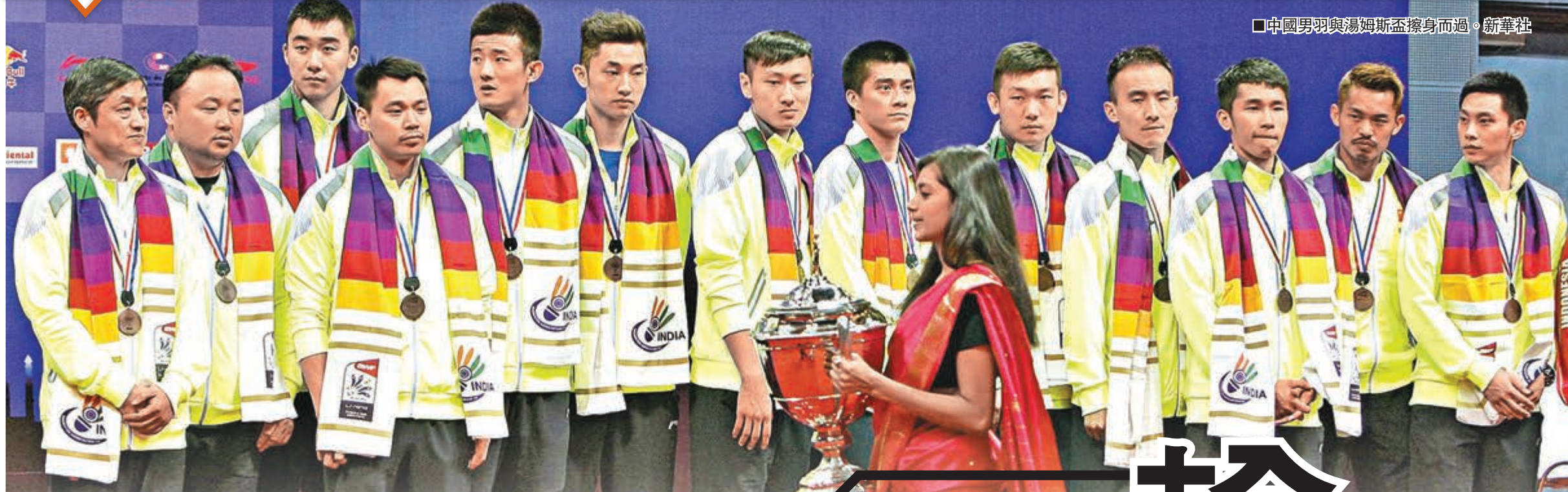
中國男羽與湯姆斯盃擦身而過。新華社