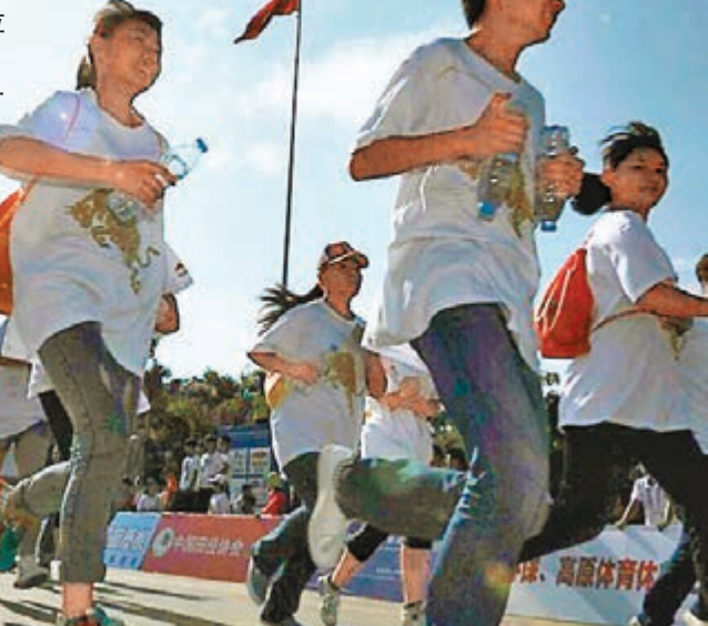
昆明半程馬拉松25日舉行。網上圖片

昆明近期連續出現高溫，24日最高溫度更是突破1958年以來5月極值，25日天氣最高溫度達30度。事後網友紛紛猜測高溫也是令參賽者出現不適的重要原因。 「昆明高原國際半程馬拉松賽」始於2012年，今年是第三屆，是國家體育總局田徑運動管理中心批准的高海拔國際半程馬拉松賽。據媒體報道，今年參賽人數較上屆增長了3倍，達到1萬餘人。賽程中一共安排了8處飲水點，且得到了一些公司的贊助，但據參加者反映，供水點儲水量少，很快就沒有水可飲用，甚至到了比賽終點補水都還存在困難。