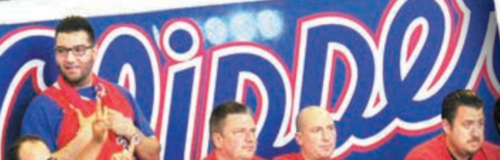
伊巴卡極速復出，令人驚訝。