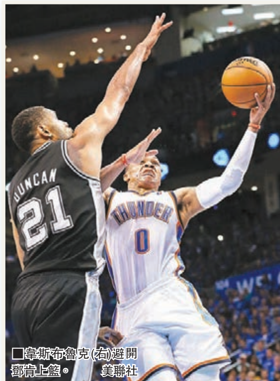
韋斯布魯克(右)避開鄧肯上籃。

雷霆得到伊巴卡坐鎮內線，防守力大幅提升，全隊共拿下52個籃板球，較馬刺多16個，並限制馬刺的投射命中率由首2場的逾50%，減至今仗的40%以下，當中在首2場分別貢獻14分和22分的馬刺後衛東尼柏加，是役受傷患困擾影響手感，13次起手只命中4球，全場僅得9分，即使贊奴