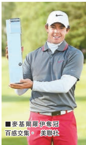
麥基爾羅伊奪冠百感交集。

麥基爾羅伊今年參加11項賽事，共有8次屈居亞軍，但自從日前狠撇禾琪後，這名世界排名第10位的25歲球手在寶馬錦標賽最後一輪比賽打出低標準桿6桿的66桿，最終以總成