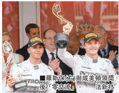
羅斯保(右)與威美頓領獎後「零交流」。

平治車隊在開季至今的6站F1賽事包辦冠軍，可是一對車手威美頓與羅斯保的激烈競爭，已令二人的好友關係改變，漸變不和，在摩納哥站成為「受害者」的威美頓更明言，二人都是競爭者，直指外界不要希望二人是好朋友。