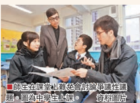
師生在課堂上難免會討論爭議性議題。圖為中學生上課。 資料圖片