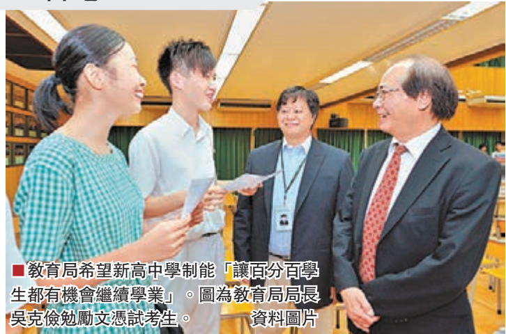
教育局希望新高中學制能「讓百分百學生都有機會繼續學業」。圖為教育局局長吳克儉勉勵文憑試考生。 資料圖片

新學制2009年在全港中學中四級正式推行，第一屆新高中學生在2012年完成中學教育，參與首次中學文憑試。2013年4月19日，教育局、課程發展議會與考評局舉行「新高中學習旅程逐步邁進」研討會，公開發表《新學制檢討進展報告》，引起學界廣泛討論。香港中學校長會新學制專責小組開展工作會議，特別設計新學制檢討調查問卷，在2013年5月9日至6月10日期間向全港中學進行調查，收集學校對《新學制檢討進展報告》的意見，結果發現當局與學界對新學制的成效有落差。