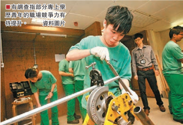
有調查指部分專上學歷青年的職場競爭力有待提升。 資料圖片