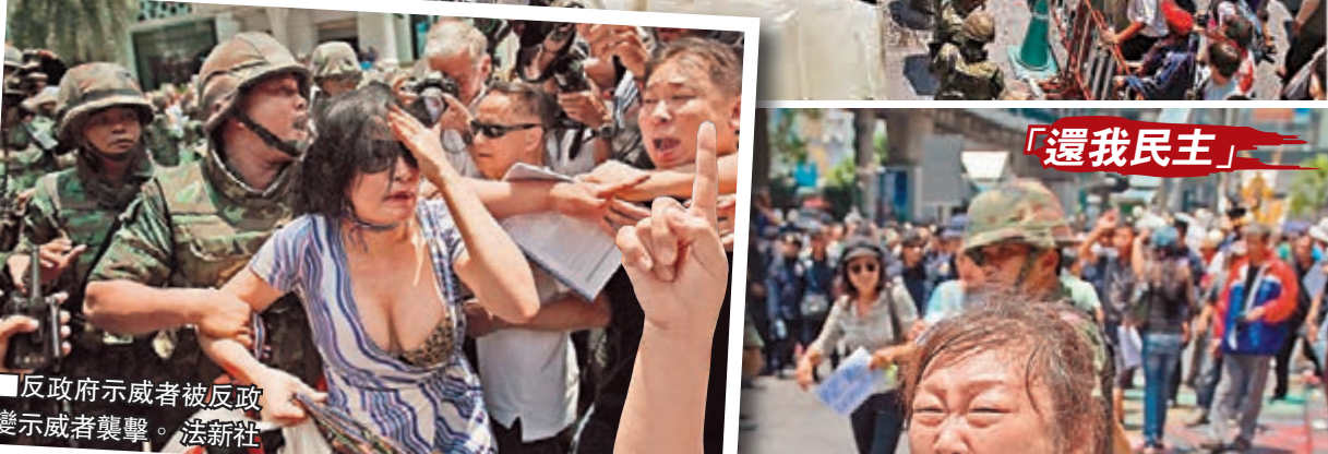
反政府示威者被反政變示威者襲擊。