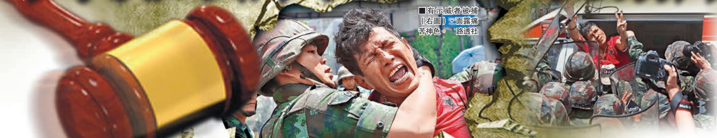
有示威者被捕(右圖)，面露痛苦神色。