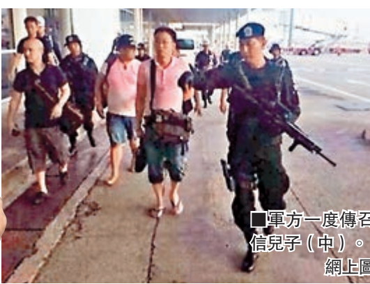
軍方一度傳召他信兒子(中)。 網上圖片

亞馬遜在德國亦以類似手段封殺邦尼爾，更向對方直認近日延遲送貨是與日前正進行的談判有直接關係。 ■《紐約時報》/美聯社