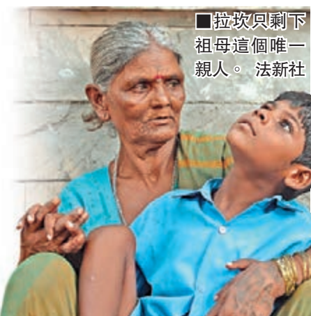
拉坎只剩下祖母這個唯一親人。