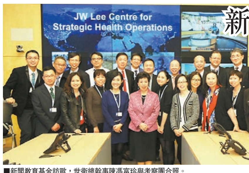
新聞教育基金訪歐,世衛總幹事陳馮富珍與考察團合照。

新聞教育基金自2008年首次舉辦海外考察活動以來,已先後前往美國及歐洲考察各2次,日後仍將繼續籌辦類似活動,以擴闊視野,加強業界培訓。