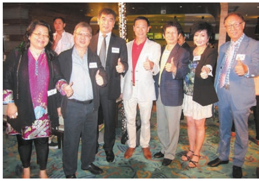
香港品牌總商會眾首領齊齊豎起大指讚香港品牌。