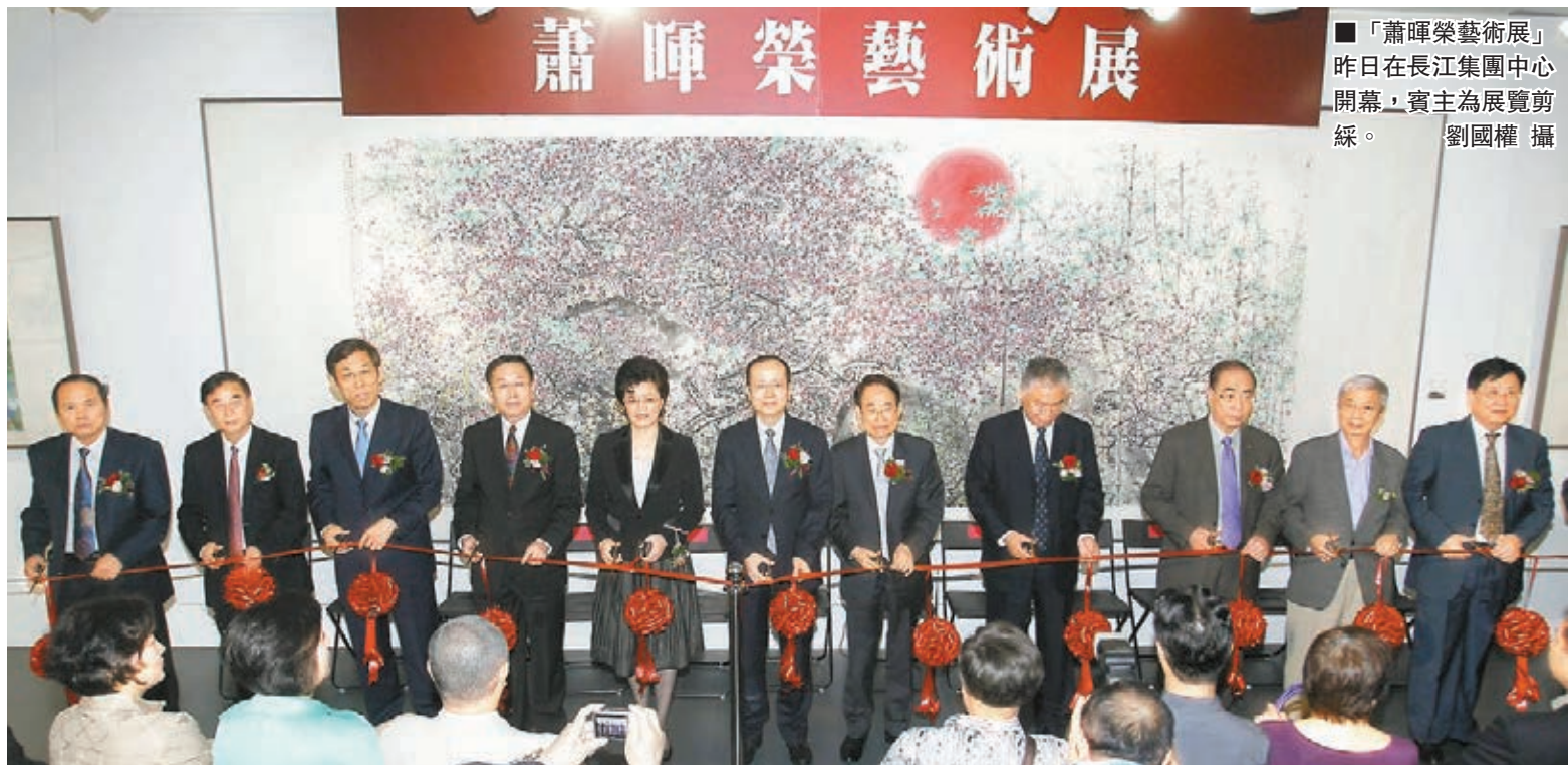
「蕭暉榮藝術展」昨日在長江集團中心開幕,賓主為展覽剪綵。

香港文匯報訊(記者 陳熙)「蕭暉榮藝術展」昨日假長江集團中心隆重開幕,展出蕭暉榮近十年來創作精品逾百件,涵蓋國畫、書法、雕塑、紫砂壺等藝術門類。中聯辦副主任楊健,外交部駐港副特派員姜瑜,中國文聯書記處書記郭運德,中聯辦九龍工作部部長何靖等出席主禮,與近百名藝術愛好者共賞名作。