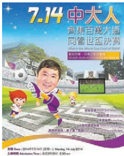
▲沈祖堯約中大人 百萬大道睇世盃,該校更製作了卡通海報加以宣傳。

香港文匯報訊(記者歐陽文倩)香港中文大學校長沈祖堯向來與學生打成一片,繼4年前「世界盃年」他甫上任即在「百萬大道」辦賽事直播後,近日他再向一眾中大人發出邀約,於香港時間7月14日凌晨2時半世界盃決賽當日,一起到百萬大道的大螢幕下觀看賽事直播,歡迎學生、職員及校友參加。