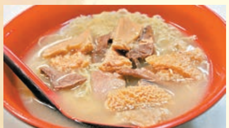
■牛雜檔：街市裡的明星美食。牛雜檔，價廉物美的大眾美食。

與新馬路板樟堂前地通往大堂的那一帶的牛雜檔相比，位於下環街市內的這家牛雜檔則有另一份滋味。一般來光顧街市的熟食檔的都是來自附近的街坊。因此，這裡的食物都特別價物美！ 地址：下環街市內