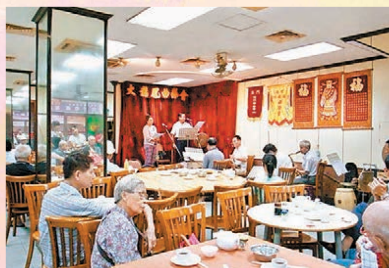
■大龍鳳茶樓：票友們聚會，一壺茶，幾碟點心，聽一段粵劇。

典型舊式茶樓格局，與老友相聚在此，叫上一壺茶，幾碟點心，愜意自在。下午時段更有粵曲茶座，一如時光倒流，散發出濃濃的復古味。 地址：十月廿五街127號