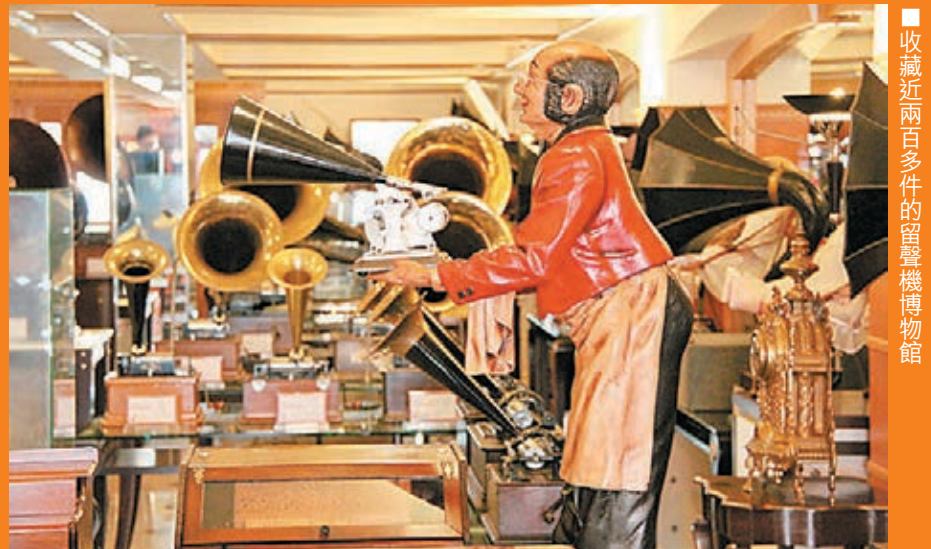
■收藏近四十年多的留聲機博物館

地址：草堆街13-15號太平電器廣場三樓 開放時間：上午11時至下午5時(須於參觀前一天預約，不接受星期六、日參觀。預約電話：(853) 28921389, 28920230) 票價：澳門幣30元 巴士路線：18(於草堆街下車)