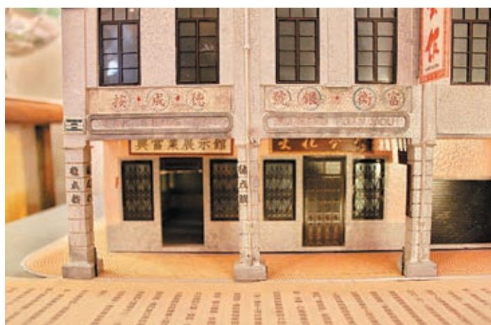
■德成按的微型模型