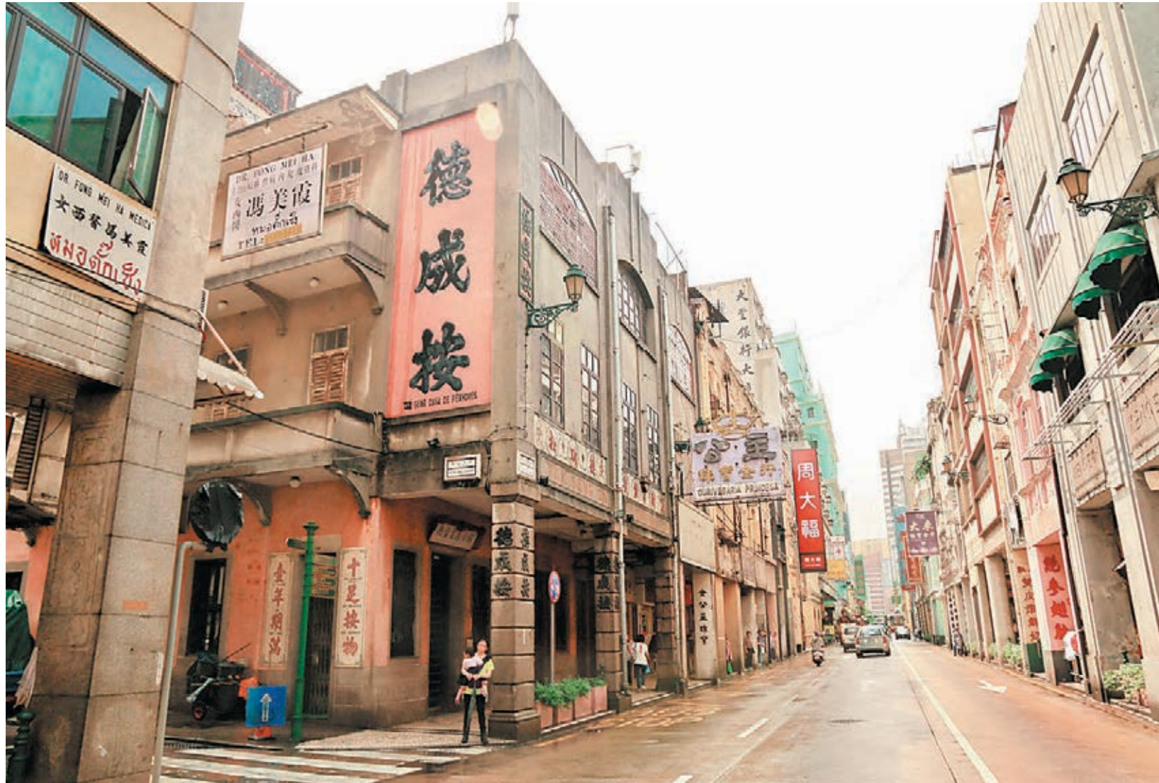
■雨後的德成按，多年之後，依然是新馬路上一個地標式的建築。

■百年歷史的仁慈堂，位於遊客必經之地的議事亭前地，這座百年歷史的博物館常常被人錯過。