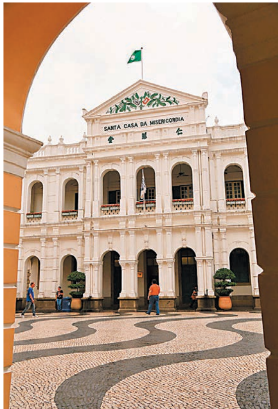
■仁慈堂內的會議室

地址：仁慈堂右巷二號(議事亭前地) 開放時間：每日上午10時至下午4時；下午2時30分至5時30分。逢星期一及公眾假期休息。 票價：澳門幣五元；學生及65歲以上長者免費 巴士路線：3, 4, 6A, 8A, 18A, 19, 26A, 33, N1A