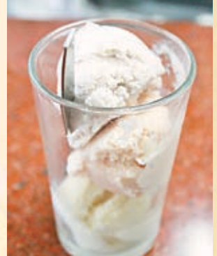
■九記冰室，最出名的要數自家的雪糕。