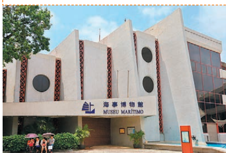
■位於媽閣廟旁的澳門海事博物館，那裡呈現的是澳門這個城市與海洋之間息息相關的歷史。

地址：澳門媽閣廟前地一號 開放時間：上午10時至下午6時，逢星期二休館 票價：星期一至六：10歲至17歲澳門幣5元；星期日澳門幣3元；星期一至六：18歲至64歲澳門幣10元，星期日澳門幣5元；10歲以下、65歲或以上者免費。 巴士路線：1, 2, 5, 6B, 7, 10, 10A, 11, 18, 21A, 26, 28B, MT4, N3