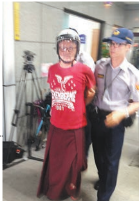
■一名蕭姓通緝犯(紅衣)昨日搭捷運時手持銼刀，當場被逮。