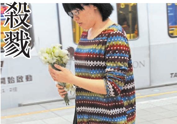
■發生意外的江子翠站有不少民眾主動獻花，悼念受害者。

馬英九並表示，看到昨天慘案發生的當時，有勇敢的民眾挺身而出，以雨傘甚至肉身擋在兇嫌面前，保護其他民眾。「我們相信，絕大多數台灣人即便在危難時，都會向彼此伸出援手，這是我們台灣最可貴的資產，我們大家必須彼此扶持，守望相助，這才是真正的台灣」。