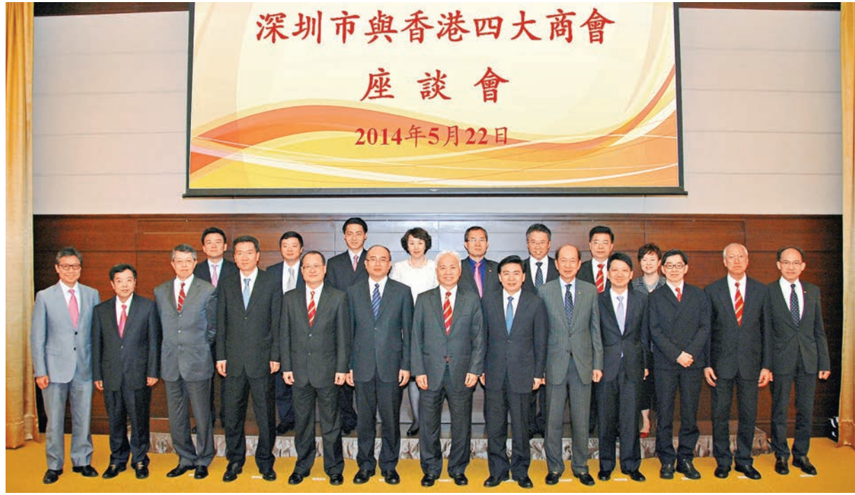
■深圳市與香港四大商會舉行座談會，賓主合影。