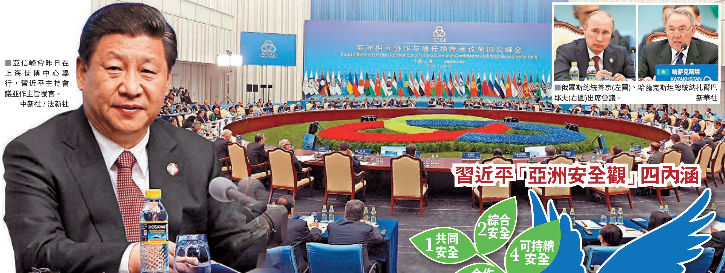
俄羅斯總統普京(左圖)、哈薩克斯坦總統納扎爾巴耶夫(右圖)出席會議。

亞信峰會昨日在上海世博中心舉行，習近平主持會議並作主旨發言。