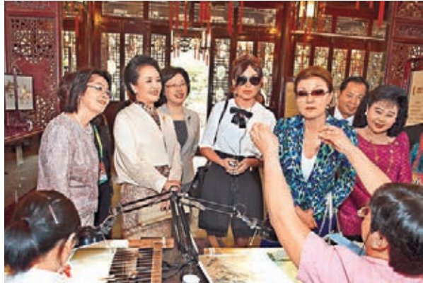
彭麗媛和夫人團欣賞編繡傳承人蘇惠萍用細線一次成功穿過針眼。

亞信峰會期間，夫人團的行程亦是外界焦點。夫人團昨日來到上海豫園，上海在內地雖以「洋氣」著稱，但東道主習近平夫人彭麗媛為客人們奉上的仍然為中式「文化大餐」，京劇、昆曲、古琴、書法、剪紙……博大精深的中國文化，讓太太們樂而忘返。