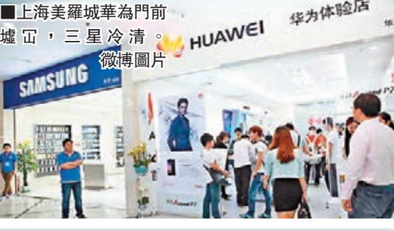
上海美羅城華為門前,三星冷清。

製作單位:中國·永康五金指數編制辦公室 浙江中國科技五金城集團有限公司 網址: http://www.ykindex.com/ 電話: 0579-87071566 傳真: 0579-87071567