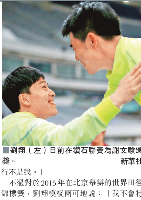
劉翔（左）日前在鑽石聯賽為謝文駿頒獎。

劉翔還透露，給謝文駿頒獎是自己主動爭取來的：「臨時決定的，因為本來聽他們說是贊助商去頒獎的，但後來我來領了，我跟他們提出了我的意見，但最後執