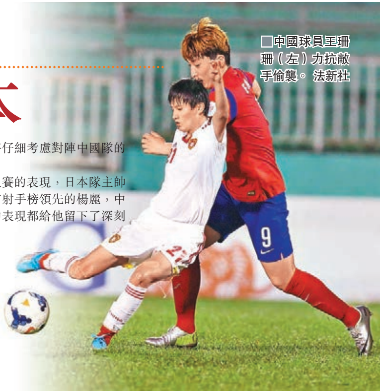
中國球員至珊（左）力抗敵手偷襲。

11歲華裔女孩躋身高球大滿貫 11歲的美籍華裔女孩露西李（Lucy Li）通過資格賽獲得今年美國女子公開賽參賽資格，她將成為這項大滿貫賽事史上最年輕的參賽選手。