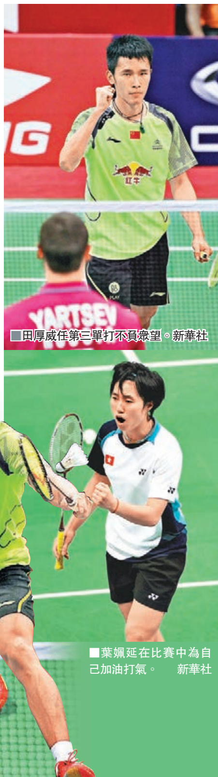
田厚威任第三單打不負眾望。