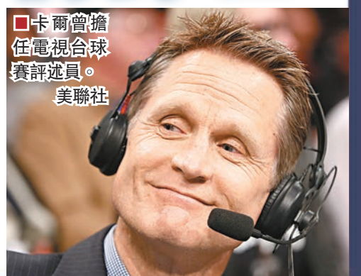
卡爾曾擔任電視台球賽評述員。