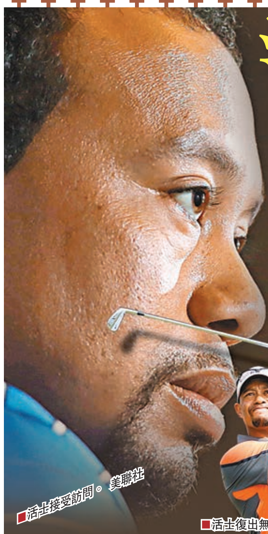
活士接受訪問。