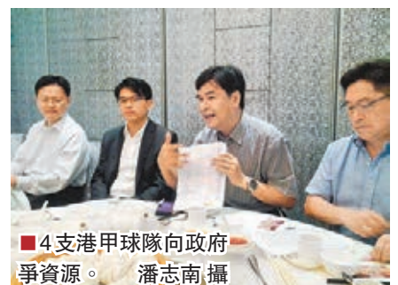
4支甲組球隊向政府爭取資源。

香港文匯報訊(記者潘志南)4支極可能出戰首屆港職聯的地區足球隊，皇室南區、天行元朗、和富大埔及黃大仙的代表將在下月9日約見民政事務局長曾德成，希望政府考慮增加對區隊投放資源，建議設配對基金，以鼓勵地區隊更積極尋找贊助。