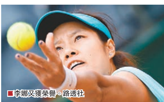
李娜又獲榮譽。

自幾天登上美國《時代》雜誌封面後，李娜又獲得一個「榮譽」，被著名運動網站SportsPro評選為「世界最具市場價值運動員」之一。費達拿、拿度、「細威」莎蓮娜威廉絲以及舒拉寶娃同時上榜。20人的名單中，網球運動員佔據25%。