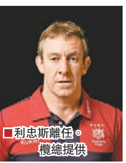
利志斯離任。檯總提供