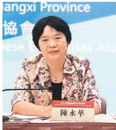
■江西省國資委黨委書記陳永華。

香港文匯報訊（記者 王道、劉蕊）記者從江西省國有企業發展混合所有制經濟投資洽談會上了解到，江西省國資委篩選出總投資額達 1,096.05 億元人民幣，下同的 49 個重點項目，進行全方位、立體式推介招商。據江西省國資委黨委書記陳永華介紹，江西將積極吸引各類資本、先進技術、人才隊伍等生產要素，大力發展混合所有制經濟。