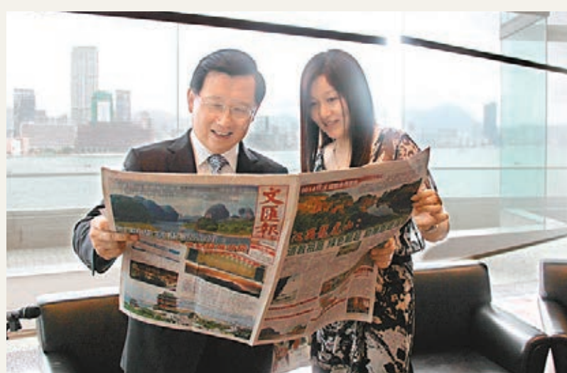
■本報記者王道向江西省委書記強衛(左)介紹本報關於江西招商相關報道。

香港文匯報訊（記者 王道、劉蕊）5 月 20 日，首次以江西省委書記身份率團訪港的強衛在香港會展中心陸續會見了香港理文集團董事長李文俊、華南城控股有限公司董事長鄭松興等企業代表。 會見間隙，強衛看到了香港文匯報頭版報道的《江西省委書記強衛：激活紅色基因 推動發展升級》，他高興地說，香港文匯報時刻關注江西，能夠在第一時間捕捉到江西的發展新動態。當他看到記者在拍照時，他特意將報紙展平舉起，他說，「你們為江西做宣傳，我也要為文匯報做廣告。」