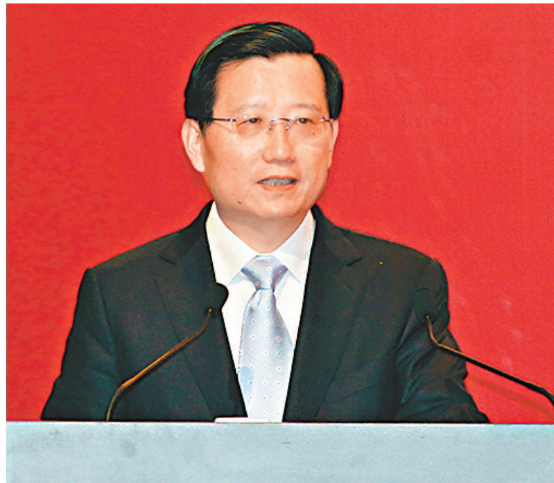
■江西省委書記、省人大常委主任強衛表示，江西的區位優勢凸顯，是港商進入的極好時機。

香港文匯報訊（記者 卓建安）「江西省發展升級投資合作推介會」昨日在港舉辦，取得豐碩成果，即場簽訂 85 個項目，涉及金額達 97.68 億美元（約 762 億港元）。江西省委書記、省人大常委主任強衛表示，隨著鄱陽湖生態經濟區和長江經濟帶戰略的提出，江西的區位優勢更加凸顯，是港商進入江西的極好時機。