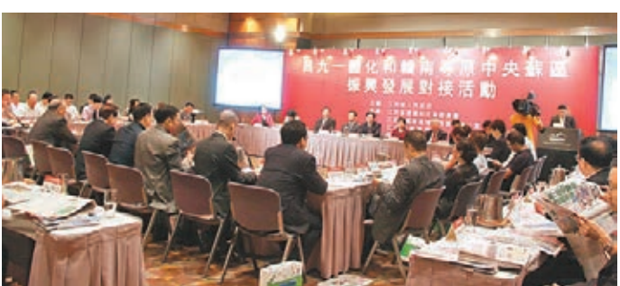
■昌九一體化和贛南等原中央蘇區振興發展對接會現場。

香港文匯報訊（記者 王道、劉蕊）江西省委書記強衛此次赴港招商，其推介重點之一便是昌九一體化和贛南等原中央蘇區振興戰略規劃。5 月 20 日上午，昌九一體化和贛南等原中央蘇區振興發展對接會吸引了不少商客的到來。