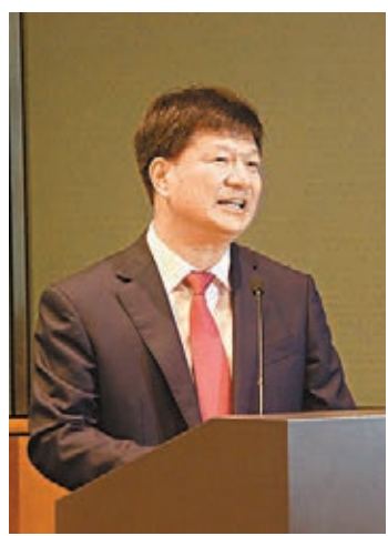
■鷹潭市委書記陳興超在港向客商重點推介了鷹潭的節能照明產業。

香港文匯報訊（記者 王道、劉蕊）5 月 20 日上午，隨江西省委書記強衛訪港的鷹潭市委書記陳興超，在港向客商重點推介了鷹潭的節能照明產業。