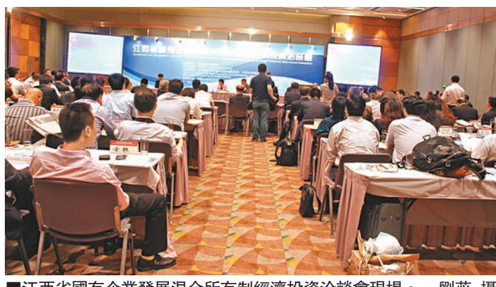
■江西省國有企業發展混合所有制經濟投資洽談會現場。

一次性拿出這麼多優質項目和企業，同步進行股權多元化改革和項目招商，在該省國企改革發展史上，尚屬首次。