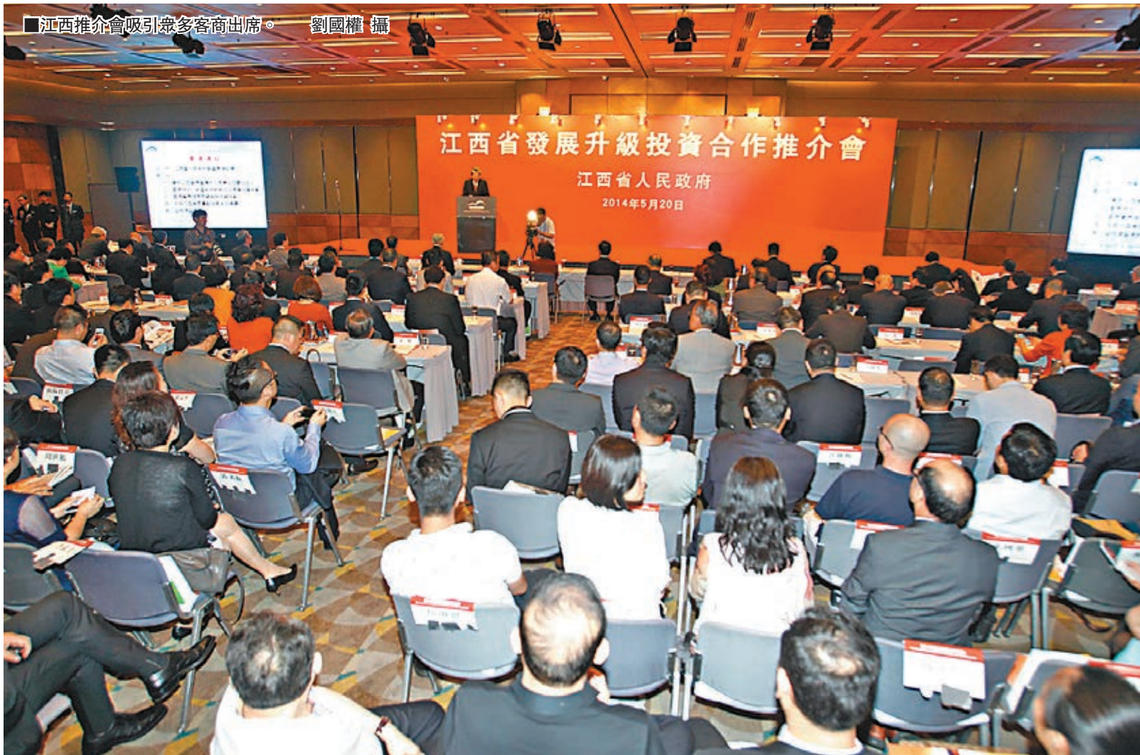
■江西推介會吸引眾多客商出席。

江西省於本周一至本週三在香港舉辦「2014 贛港經貿合作活動」，這是江西省連續第 13 年到香港舉辦經貿合作活動。香港是江西利用外資的主要來源地。截至去年底，香港累計在贛設立港資企業 9,878 家，江西累計利用港資 329.67 億美元。