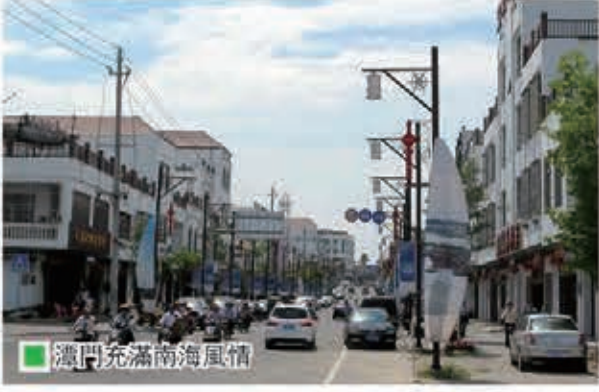
潭門充滿南海風情