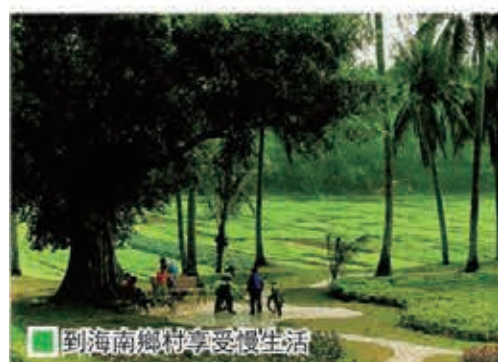
到海南鄉村享受慢生活