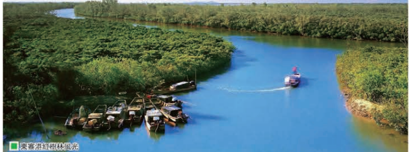
東寨港紅樹林風光