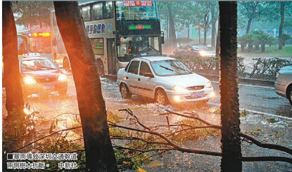
暴雨導致深圳交通幹道兩側樹木折斷。

香港文匯報訊(記者郭若溪深圳報道)深圳昨日下午突降大暴雨,連續3小時的強降雨導致全市水浸33處,是深圳自3月30日以來的第五場特大暴雨。深圳市氣象局發佈分區暴雨紅色預警,中小學、幼兒園、托兒所停課。同時,深圳機場進出港航班受到不同程度影響,60個進出港航班取消,其中飛往北京的「空中巨無霸」A380更一度備降廣州,延誤近4小時。廈深鐵路更一度限速緩行。