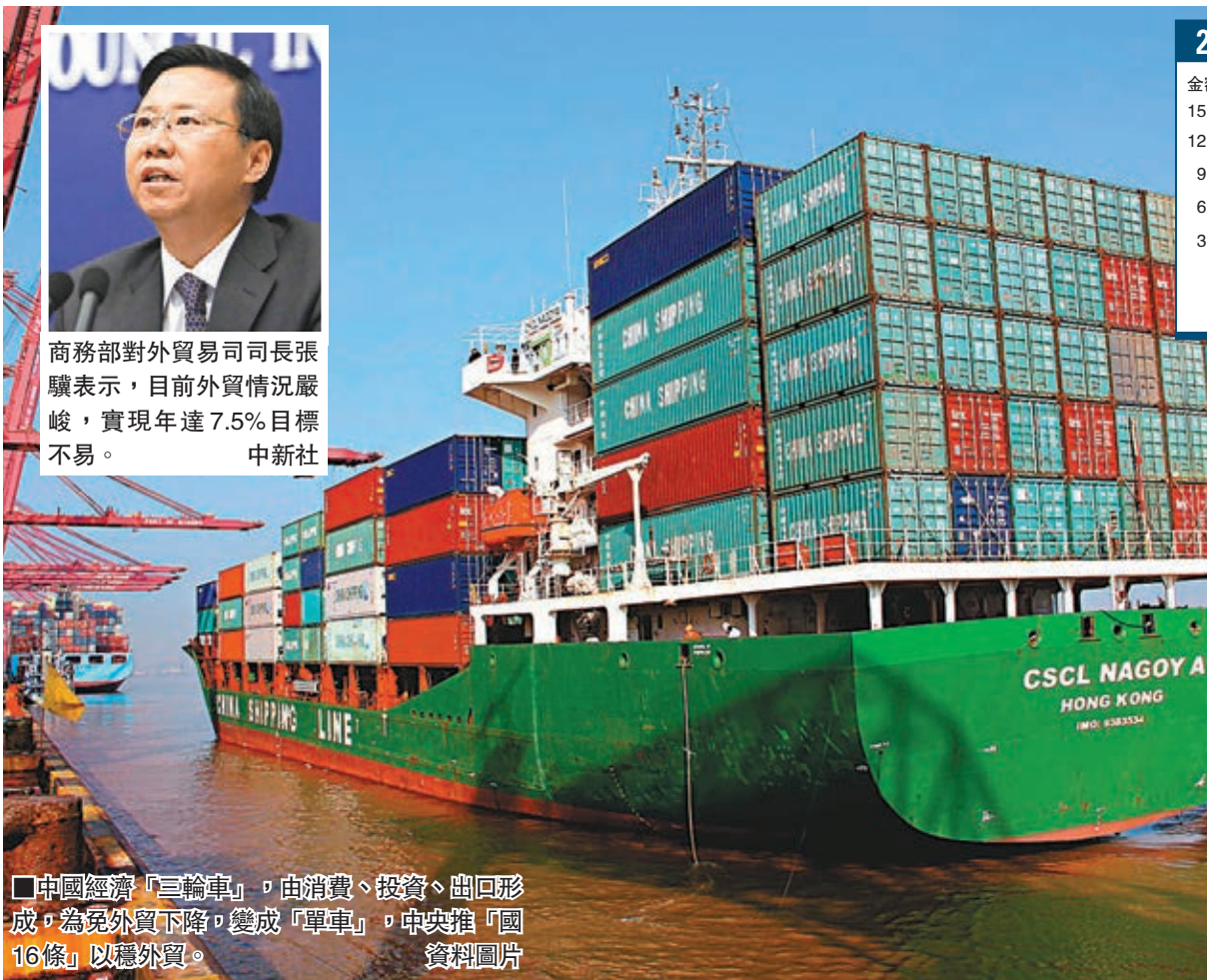
中國經濟「三輪車」,由消費、投資、出口形成,為免外貿下降,變成「單車」,中央推「國16條」以穩外貿。

香港文匯報訊(記者馬琳北京報道)今年首4月,中國外貿進出口與出口罕見地出現了雙降現象,為防穩增長的「三輪車」變「兩輪單車」,國務院辦公廳近日出台了「國16條」,出手穩定外貿。中國商務部對外貿易司司長張驥昨日在北京表示,商務部將集中在兩個月內,落實包括「支持服務貿易發展」、修訂加工貿易禁止類和限制類商品目錄等35項相關政策。但他同時坦言,今年中國外貿形勢嚴峻,要實現全年外貿增長7.5%的既定目標,是一件艱巨任務。