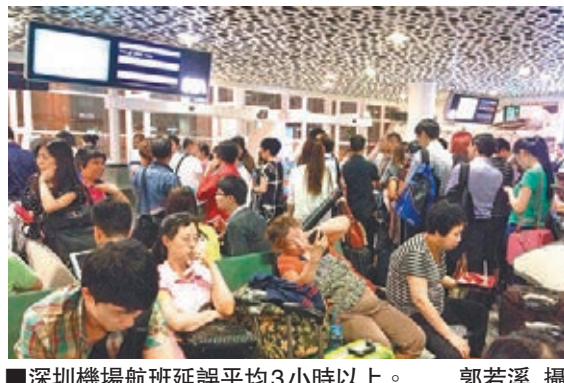
深圳機場航班延誤平均3小時以上。

記者從深圳北站獲悉,受短時大暴雨影響,廈深線惠州東至李朗間雨量超警戒值,鐵路部門為確保安全採取區段限速措施,致廈深線部分動車組出現不同程度晚點。