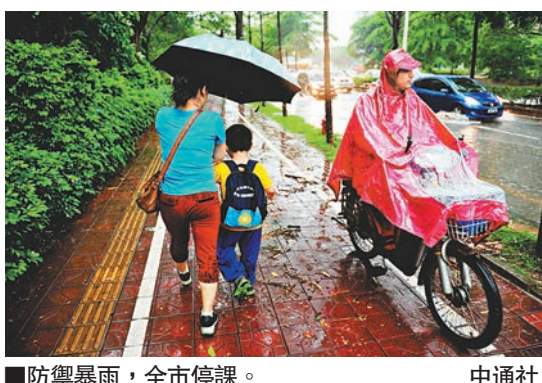
防禦暴雨,全市停課。