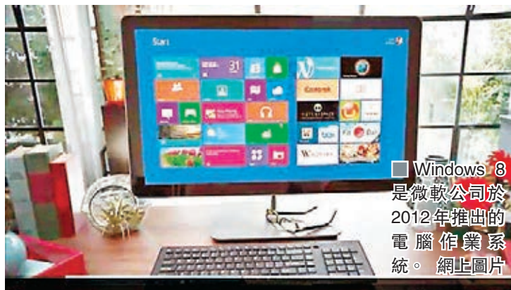
Windows 8是微軟公司於2012年推出的電腦作業系統。網上圖片

香港文匯報訊(記者 謝孟謙)中國政府採購網昨公告，指在一個正在進行的電腦產品招標裡面(「信息類協議供貨強制節能產品補充招標」)，禁止所有電腦產品(「計算機類產品」)安裝Windows 8系統。該份簽署日期為5月16日的公告顯示，此次Windows 8禁令，涵蓋範圍甚廣，包括便攜式電腦、平板電腦、桌上電腦等。公告並無豁免個別電腦類型，直接指出「所有計算機類(電腦)產品不允許安裝Windows 8操作系統」。該次網上投標系統開放時間為昨日(20日)下午兩點至後日(23日)下午五點，投標供應商須準時登錄系統申請投標，並提交相關產品資料。產品入圍後，將在採購中心的「網上商城」銷售，中標供應商須配合相關工作。