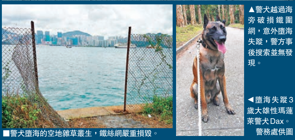
警犬墮海的空地雜草叢生，鐵絲網嚴重損毀。