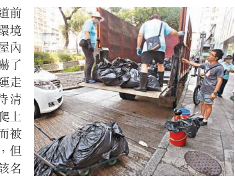
食環署出動兩部大貨車為「垃圾屋」清理垃圾。

香港文匯報訊(記者 杜法祖)深水埗大埔道前日揭發母死子昏迷的「垃圾屋」現場，食物環境衛生署昨晨派出12名男女清潔工人到場清理屋內堆積如山的垃圾，有工人看見屋內垃圾之多嚇了一跳，估計有不少於2噸，昨日花了8小時，運走3大貨車垃圾收工後，仍有逾半屋垃圾尚待清理。其間更有工人被屋內「屍蟲」(蛆蟲)爬上身。前日在消防員破門入屋期間因垃圾起火而被焗暈的「長毛」男子，昨仍在明愛醫院留醫，但情況已由「危殆」轉為「嚴重」。警方相信該名長髮及膝、年約40歲中年男子，是死在「垃圾屋」單位內76歲女戶主譚×娟的兒子。