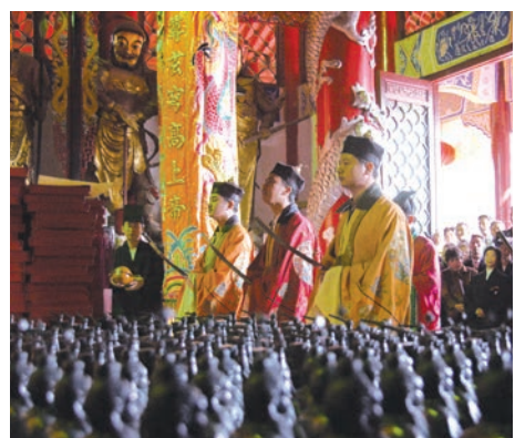
■ 道教祖庭法事科儀。龍虎山景區配圖

仙女岩是大自然鬼斧神工的精湛傑作，被譽為「華夏之惟一，域外更無雙」的曠世奇觀、「天下第一絕景」。當地民間流傳之為「大地之母」，將其看成是地母的化身，看做是生命的源泉。