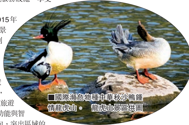
■ 國際瀕危物種中華秋沙鴨鍾情龍虎山。

程看景、手機購票、遠程環境監測與發佈、無線LED信息發佈等遊客服務系統，電子門票、遊客統計、視頻監控、GPS車輛調度等內部管理系統，防火預警系統、地質災害遠程監測與預警等應急管理系統；在主要景區和重點區域逐步實現「wifi」全覆蓋，助推旅遊產業轉型升級。