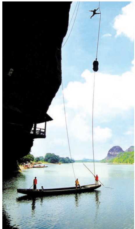
■ 仿古升棺表演是遊客首選。