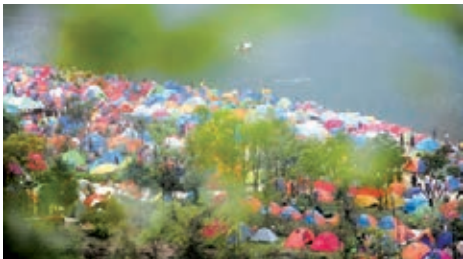
■ 龍虎山國際帳篷節每年吸引上萬戶外愛好者參加。

而龍虎山正乘著旅遊強省的快車，致力於通過產業升級、建設提速、文化統領、創新發展，力爭實現「三個轉型」的目標，即由門票經濟向產業經濟轉型，過