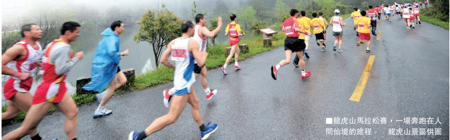
■ 龍虎山馬拉松賽，一場奔跑在人間仙境的旅程。