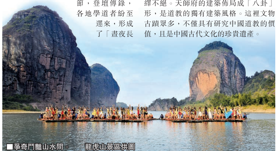
■ 爭奇鬥豔山水間。