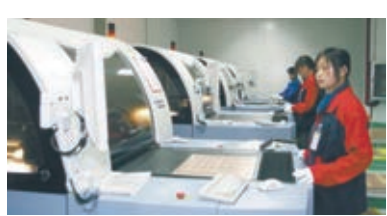
■紅板(江西)有限公司生產車間。