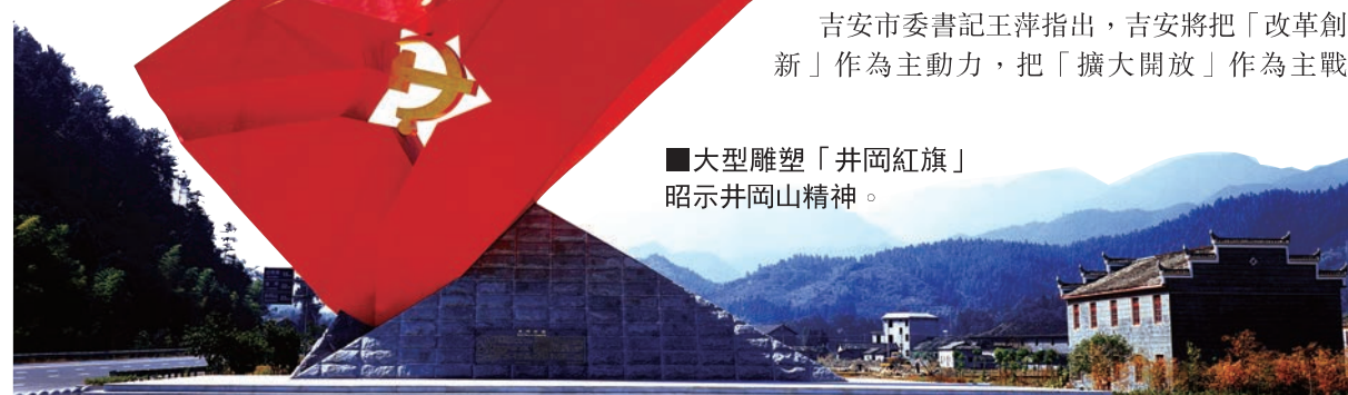
■大型雕塑「井岡山紅旗」昭示井岡山精神。

吉安是一座帶有水的城市，江西章水、貢水二江合流，匯成贛江，晝夜不息由南往北，默默孕育河文明，滋