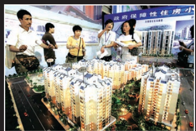
■粵允許民資參與保障房建設。