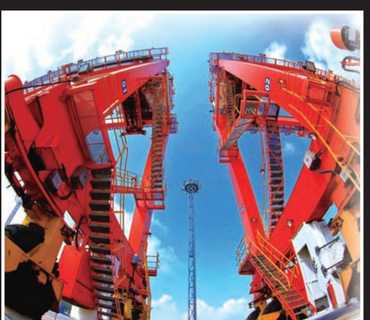
■珠海高欄港。資料圖片