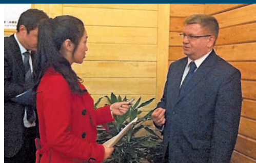
濱海邊疆區波格拉尼奇內區行政長官托多洛夫接受本報記者專訪。

記者在綏芬河採訪期間，恰逢濱海邊疆區波格拉尼奇內區行政長官一行19人代表團訪問綏芬河市，雙方就加強兩地在經貿、農業、旅遊、文