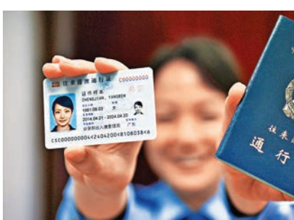
新版電子內地居民往來港澳通行證(左)。

香港文匯報訊 (記者 敖敏輝 廣州報道) 公安部今日正式在廣東試點啟用電子往來港澳通行證，舊版紙質證件將淡出歷史。昨日記者在公安部和廣東省公安廳聯合召開的新聞發佈會上獲悉，電子港澳通行證採用智能芯片記錄個人信息，持證人可使用口岸自助查驗通道實現自助通關，大大縮減通關時間。電子證件亦首次錄入持證人指紋，錄入指紋將僅限於通關之用，確保公民信息安全。香港入境處相關負責人亦表示，港方將不存儲證件中的指紋模板信息，防止指紋信息被挪作他用。