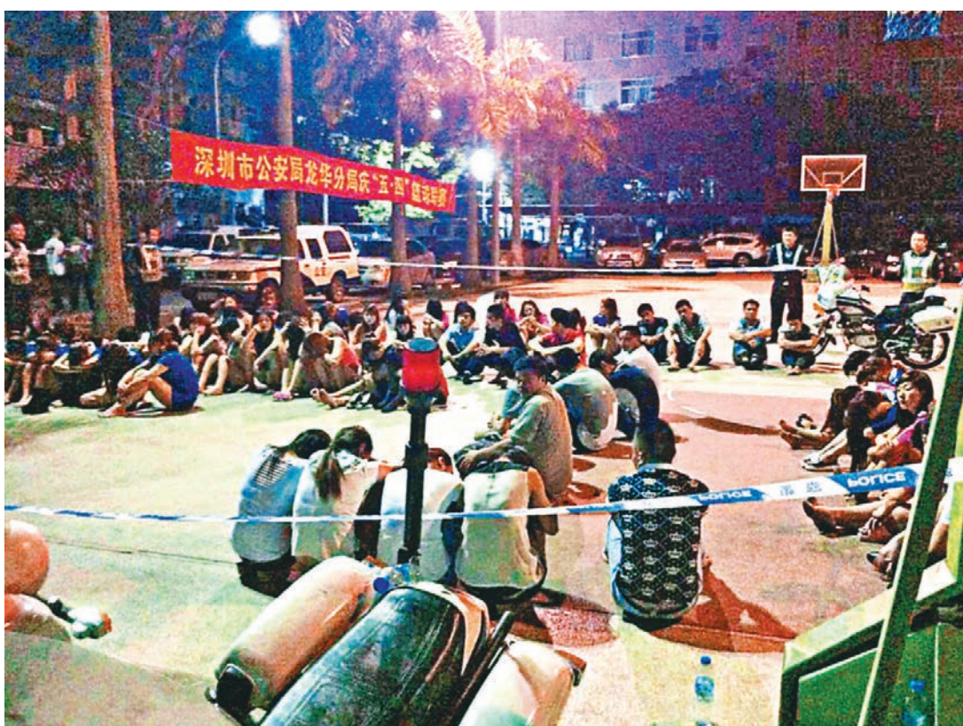
龍華警方抓捕70餘名小姐和嫖客現場。

香港文匯報訊(記者 李薇 深圳報道) 深圳龍華新區有大量娛樂場所，存在大規模賣淫活動。知情人稱，有些賣淫場所甚至直接設於小區內，市民多次報警，但得不到處理，只能求助電視媒體。有記者走訪了7家賣淫場所，掌握信息後報警，然而警方卻稱「查不到」。龍華新區黃色事業如此猖獗，疑是有警方人員作利益保護傘。及至昨日凌晨，龍華公安分局發動警力清掃轄區內4家涉黃場所，拘捕70餘賣淫小姐及嫖客。但截至記者發稿，龍華公安發言人一直為關機狀態。