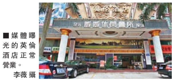
媒體曝光的英倫酒店正常營業。

本報18日廣東台《DV現場》記者在2小時內走訪深圳龍華新區7家有賣淫活動的娛樂場所，記者在掌握證據後撥打龍城派出所電話報警，但警方卻在調查回答記者：「看了，沒發現。」