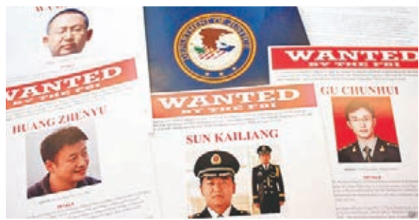
美國司法部起訴五名被告之後，立即發出通緝令。