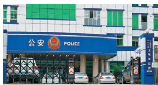
龍城派出所現場。