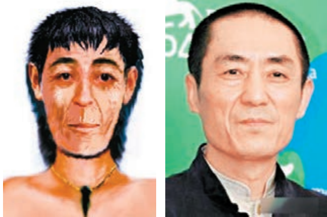
山東人祖先面孔還原酷似張藝謀。

頭蓋骨90%都缺少了側門牙，最小的十四歲左右，所以打掉側門牙可能是一種成人禮。另外，人在很小的時候將牙連根拔起的話，骨骼會收縮，完全看不出來拔牙，所以，拔出側門牙也有可能為了美觀。隨後，中國著名刑事相親專家、痕跡考古專家趙成文還利用頭骨還原技術將該頭蓋骨進行了復原，並向現場觀眾介紹了頭骨還原的詳細過程。但復原之後的人像令大家大吃一驚——滿臉褶子、大眼睛，整體像極了張藝謀，但臉型像李詠一樣是個大長臉，而其顴骨又有馮小剛的影子，活脫脫一個明星混合臉。據曾雯博士推斷，此人在古代也是一個美男子呢。