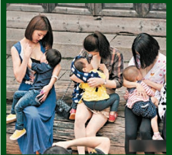
母乳媽媽「哺乳快閃」

5月17日，福建省福州市，30多名母乳媽媽在三坊七巷舉行了「哺乳快閃」，以迎接即將到來的「5·20全國母乳餵養宣傳日」，呼籲人們對母乳餵養的關注與支持。