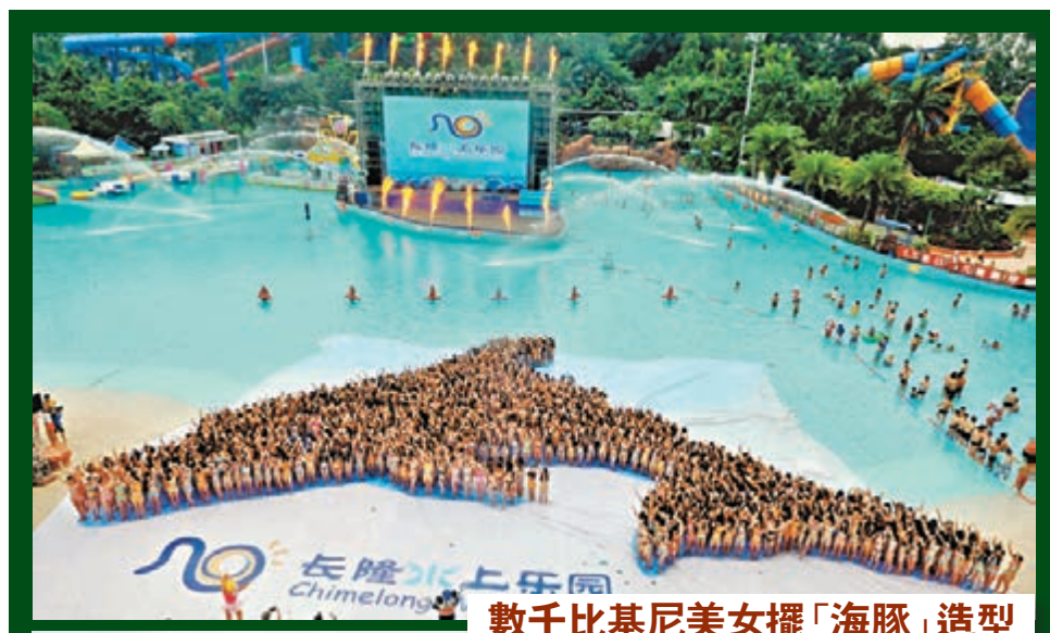
數千比基尼美女擺「海豚」造型

第七屆「長隆萬人比基尼」活動昨日舉行，數千名親麗比基尼女郎合力擺出一隻跳躍出水面的「海豚」造型，並齊聲喊出「2014馬上有水玩」的口號，為今年夏日戲水季拉開序幕。由於今年要擺出巨大的海豚圖案，線條弧度多變，所需人數和人員站位難度，堪稱「長隆萬人比基尼」歷年活動之最。據介紹，「長隆萬人比基尼」活動始於2008年，此次已是第七屆。