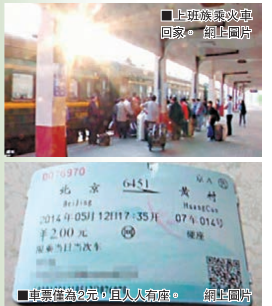
車票僅為2元，且人人有座。

在北京大興、北京市區兩地奔波的上班族最近如獲至寶：北京火車站晚上17點35分有一趟北京開往天津的6451次老式綠皮火車，與晚上高峰時擁擠的北京地鐵相比，票價同為2元，從市區坐到大興卻只需半個小時，不僅比地鐵快，而且人人有座！