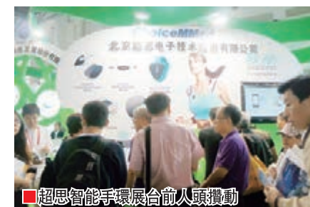
超思智能手環展區前人頭攢動

智匯未來展區，一批在智慧家居、移動辦公、智能樓宇控制以及文化創意領域中應用廣泛的技術及產品正在被展示。炙手可熱的智能手環吸引了眾多參觀者的駐足。