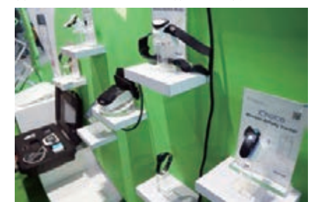
科技改變生活——穿戴式智能終端展示

據了解，在智能家居領域，中關村智能家居創新資源居國內首位。百度、京東、360等傳統互聯網龍頭企業積極試水智能家居，推出包括智能網絡設備、智能手環等產品。小米、極科極客等新興移動互聯網企業則積極佈局智能家居產業，以智能路由器產品為核心，將智能電視、智能手機、智能機頂盒等智能終端設備連接，打造智能客廳生態圈。同時，海爾作為世界家電領軍企業，已將智能家居產品研發落戶中關村。