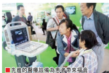
先進的醫療設備為患者帶來福音

為促進產業進一步發展，中關村管委會今年選出台了《關於加快培育大數據產業集群推動產業轉型升級的意見》，圍繞建設全球大數據創新中心的目標，提出了未來三年加快培育大數據產業集群的33條意見和舉措。