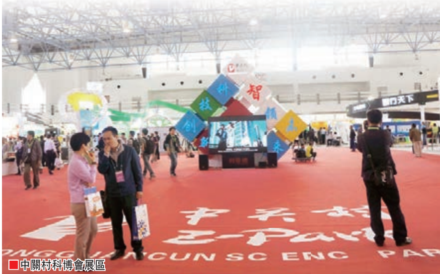
中關村科博會展區

展區有限，智慧無限。3,200平方米的地方，匯集了來自中關村十「百千工程」、「瞪羚計劃」、「金種子工程」的110多家企業，共同組成了智聯無限、智行天下、智健生活、智淨家園、智匯未來五大展區。500多項新技術新產品新服務的集中展示，演繹了中關村的「智慧方陣」。