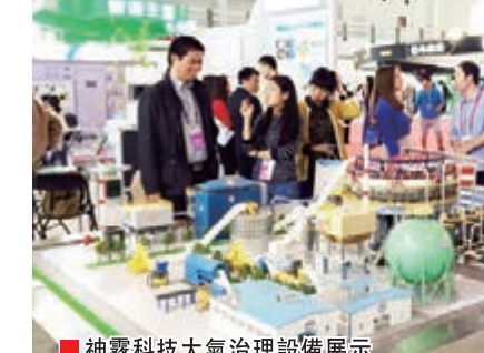
神霧科技大氣治理設備展示

目前，中關村企業已覆蓋固廢處理各環節，桑德環境是處於國內龍頭地位的垃圾處理集成服務商，高能時代的安全填埋技術、格林雷斯的建築垃圾處理技術、中礦環保的半幹化污泥處理系統、金州環境的焚燒技術、潔綠科技的滲濾液處理技術以及嘉博文的餐廚垃圾處理系統等技術都處於國內先進水平。