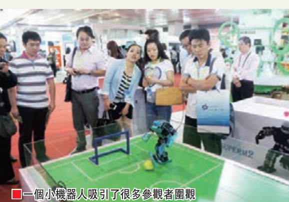
一個小機器人吸引了很多參觀者圍觀

中關村管委會負責人表示，創新創業是中關村不朽的靈魂。中關村將繼續致力於優化創新創業環境，逐步構建起一個全方位、立體式、充滿生機的創新創業生態系統，使中關村成為全國乃至全球最具吸引力的創新創業中心。