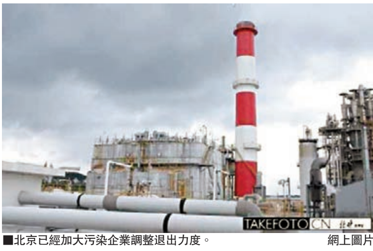
北京已經加大污染企業調整退出力度。

另據了解,北京市政府近日批准通過政策文件,簡化了原「三高」(高污染、高耗能、高耗水)企業退出的程序,加大了獎勵支持力度,調動企業調整退出的積極性。該辦法近期將聯合發佈實施。