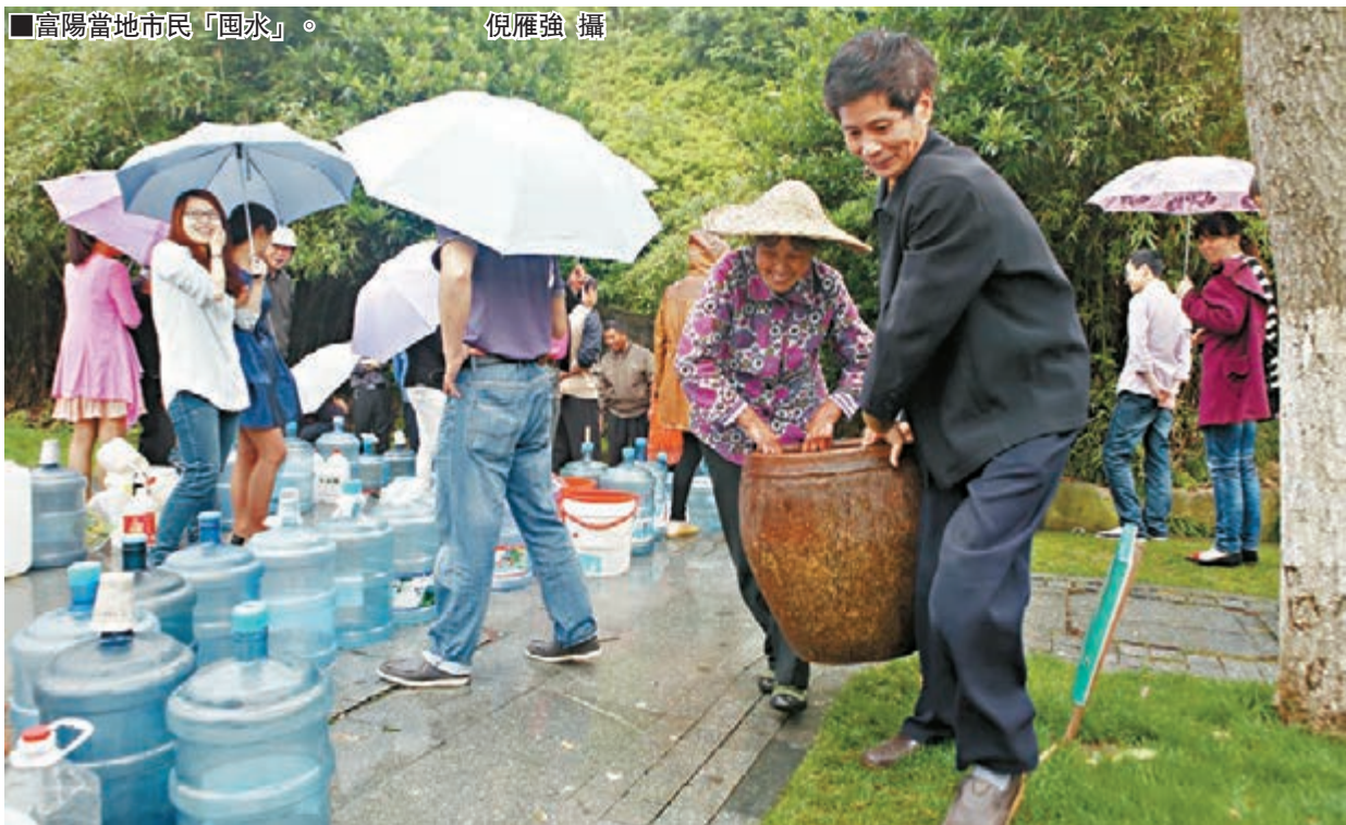
富陽當地市民「囤水」。