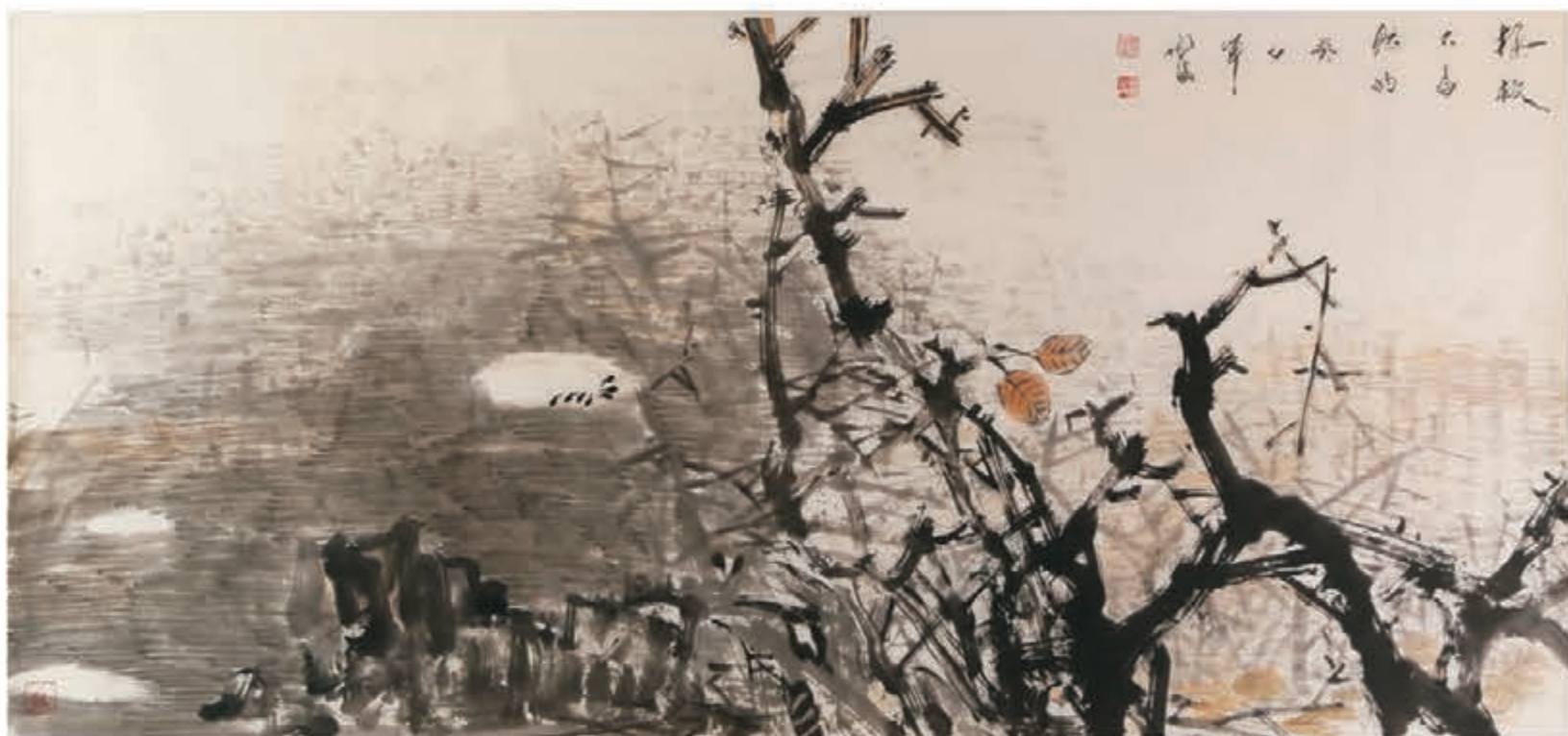
●《攝教大自然》尺寸：179.7*86cm 三片樹葉，五蛙蝌蚪，我們需要共同愛護我們的大自然。