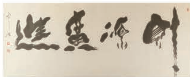
●《財源廣進》書法 尺寸：69.5*179cm 此書法以動感道勁的筆觸傳出書道的意境，暗喻得者「日進門金，財源廣進」，進而抒發一種為人生理想而奮鬥不忘的情懷。