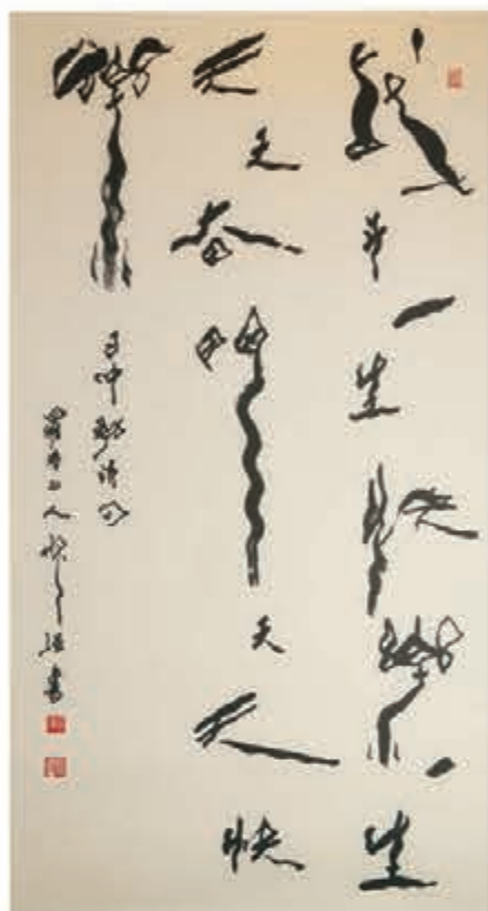
●《習仲勛名言》書法 尺寸：138*90cm 書法以習仲勛的詩為內容載體，生動激勵國人要學習其戰鬥一生，快樂一生，天天奮鬥，天天快樂的革命樂觀主義精神及一代政治家的宏闊情懷。