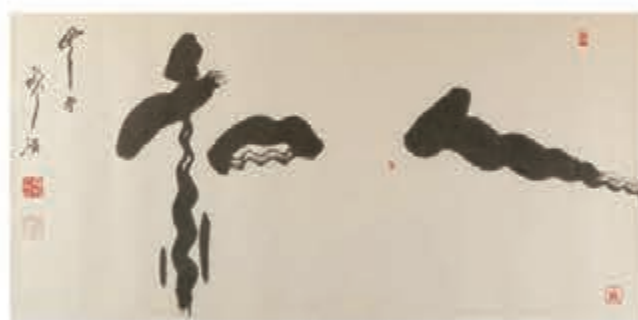
●《人和》書法 尺寸：69*138cm 人心所向，上下團結，人和百順。