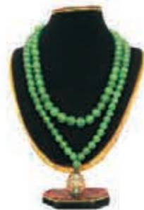
●清晚期老坑玻璃種帝王綠翡翠朝珠 重量：342.3g 共108顆

李公麟為官三十年，與王安石、蘇東坡等過從甚密，兼其大政治家氣度及大文學家情懷。他作畫構圖堅實穩秀而又靈動自然，畫面簡潔精練，又富有變化；有真實感，又有文人情趣。李公麟最擅長畫馬和人物，他創造性的將白描發展為獨立成熟的創作形式，影響深遠，為後世師表，終成一代大家。李公麟所有繪畫作品能流傳世之作如今已如鳳毛麟角，這其中大部已流落海外，此畫作為光緒帝書法侍教彭述之子、海上大收藏家彭水若收藏。