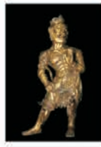
●唐貞觀力士俑造像 高度：69cm

此朝珠為清晚期老坑帝王玉玻璃種翡翠，相傳為老佛爺葉赫那拉氏最喜愛的翡翠飾品中最愛的一件。由慈禧太后賜予光緒帝，光緒帝又轉賜珍妃，為珍妃至愛。此朝珠共108顆，呈圓珠狀，帝王綠色澤圓潤，勻淨明澈，高冰玻璃種特徵明顯，燈光透射表面呈霧狀及玻璃光澤。其中最大顆直徑可達1.2厘米，規格遠超傳說中的七珍八寶。尤為難得的是此朝珠共108顆，為陽數極大值九及陰數極大值十二之倍數，寄寓陰陽調和、天地合一之意。按滿清貴族禮制，朝珠級別中屬帝王綠翡翠最為名貴。此朝珠為光緒帝書法侍教彭述之子、海上大收藏家彭水若收藏。