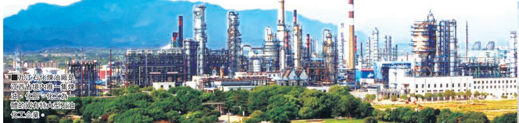
■ 九江石化煉油廠是江西省境內唯一集煉油、化肥、化工為一體的國有特大型石油化工企業。