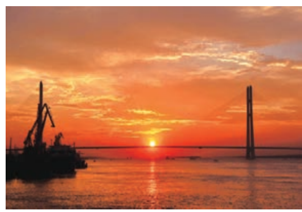
■ 長江二橋主橋南北塔。

九江位於江西省北部，是贛、鄂、湘、皖四省毗鄰之地，地處萬里長江與千里京九鐵路的交匯點上。下轄九縣二區二市及一個開發區和廬山風景名勝管理局、廬山山海風景名勝區和八里湖新區。面積 1.88 萬平方公里，人口 500 萬。