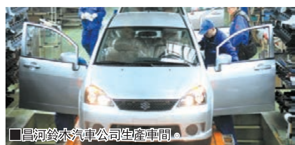
■ 昌河鈴木汽車公司生產車間。

工業是支撐綜合實力的脊樑骨，是做大經濟總量的主引擎。九江市始終按照「決戰工業一萬億」的發展目標要求，堅持對外開放，狠抓招商引資，加快培育一批百億、五十億、十億企業；着力打造一批「千萬級」、「百萬級」、「十萬級」的優勢產品基地，力爭石油化工、鋼鐵有色、現代輕紡、電力新能源四大支柱產業主營業務收入過千億，電子信息、非金屬新材料、節能電器、綠色食品、先進