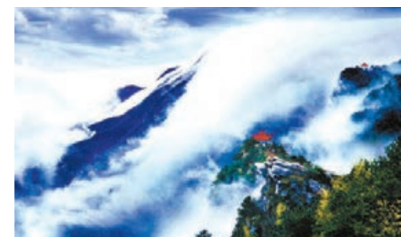
■ 坐落在九江境內的廬山。