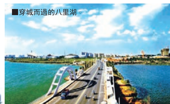
■ 穿城而過的八里湖。

區發展格局，使中心城區建成區面積達 200 平方公里，大九江都市區中心城市面積達 2200 平方公里。進一步增強城鎮作為經濟中心、文化中心和服務中心的功能，形成了佈局合理、優勢互補、協調發展的「1+5+x」沿江城鎮群，即「一個中心城區，五個衛星城市，一批沿江重點小城鎮建設。全力提升中心城區與周邊縣區的綜合交通體系建設，加速推進繞城高速、環廬山公路等路網建設，適時開通城際公交線路，加快開發城際軌道交通，構建 20 分鐘「城市圈」。