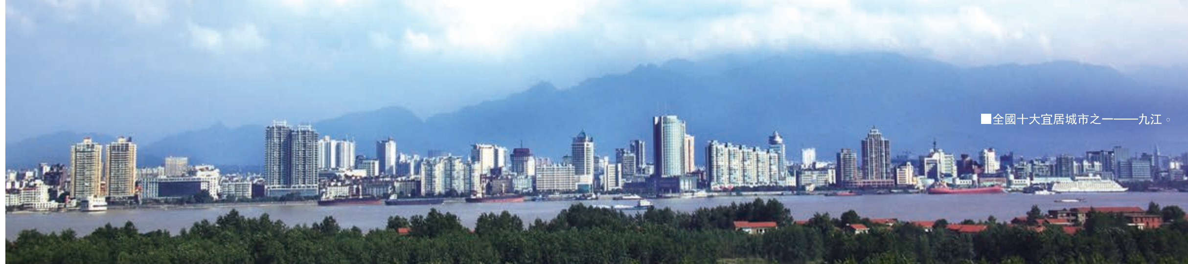
■ 全國十大宜居城市之一——九江。