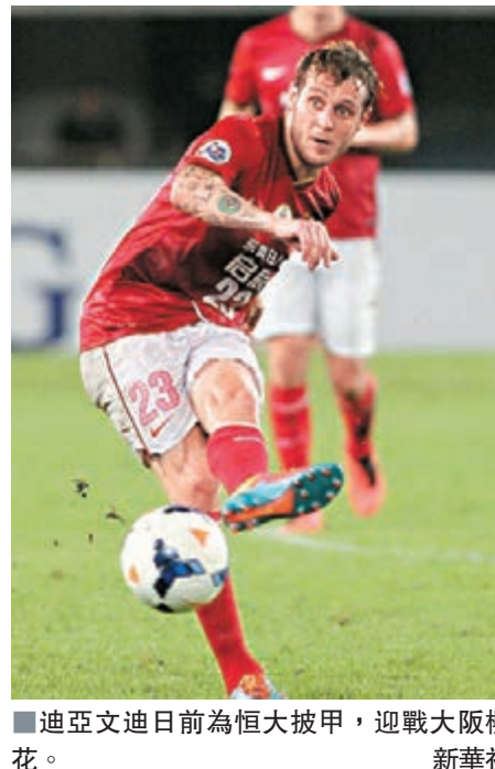
迪亞文迪日前為恒大披甲，迎戰大阪櫻花。新華社

要否認自己的確是被恒大的高領薪水所打動。等到1月24日轉會談判結束之後，對我來說那段時間的困擾也結束了，而我也會就像我一直以來所做的一樣，繼續用我在球場上的敬業精神來回報我的新東家。」