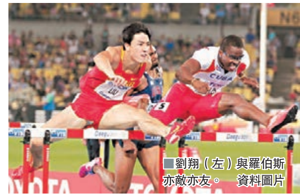
劉翔(左)與羅伯斯亦敵亦友。資料圖片