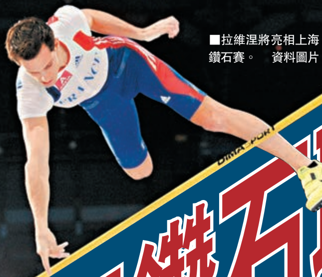
拉維涅將亮相上海鑽石賽。資料圖片