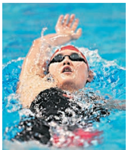
葉詩文於14日奪女子400米混合泳冠軍。

昨日，徐國義在訪問時透露，當天下午葉詩文就發燒達38度，被送去醫院，醫院診斷是急性腸胃炎。徐國義表示，考慮到接下來備戰亞運會的訓練任務艱巨，為了保護她的身體，將放棄今日的200米混合泳的比賽。 香港文匯報記者 陳曉莉