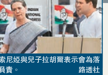
索尼婭與兒子拉胡爾表示會為落敗負責。

印度國大黨在大選中受挫，背後領導的甘地家族不僅面對選舉落敗，還面臨整個政治王朝的沒落，其勢力可能遭新總理莫迪進一步削弱。分析指，代表國大黨出戰的拉胡爾能力受質疑，更被輿論揶揄為小學生，與莫迪的老成表現大相逕庭。