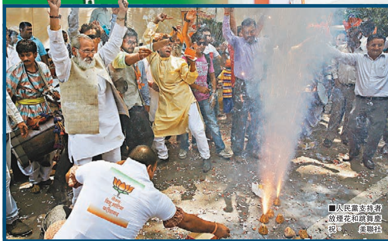
人民黨支持者放煙花和跳舞慶祝。