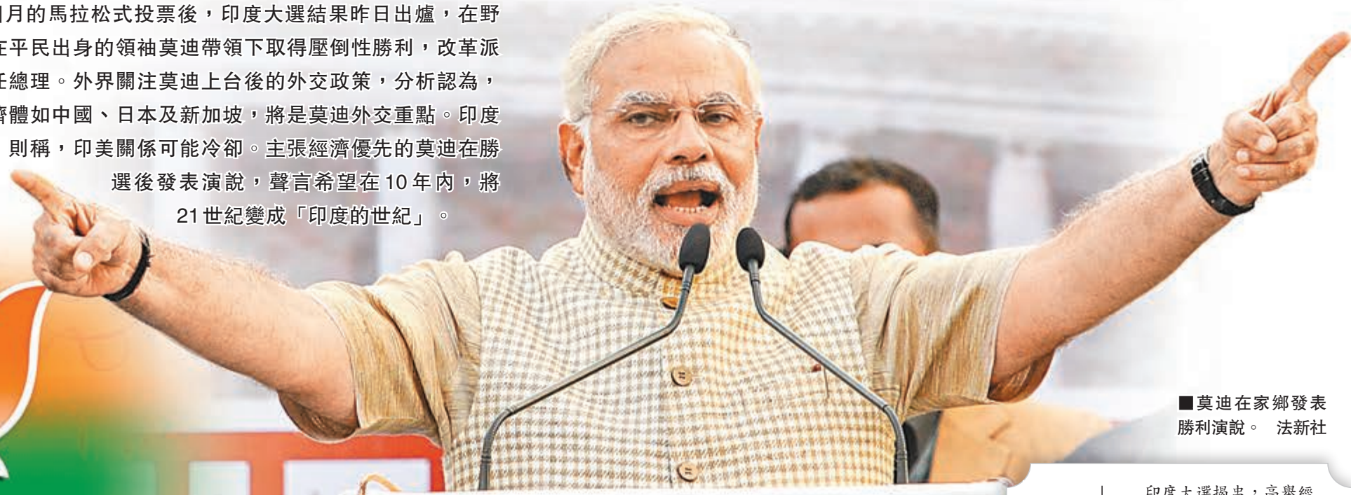
莫迪在家鄉發表勝利演說。

經過逾1個月的馬拉松式投票後，印度大選結果昨日出爐，在野印度人民黨在平民出身的領袖莫迪帶領下取得壓倒性勝利，改革派的莫迪將出任總理。外界關注莫迪上台後的外交政策，分析認為，亞洲主要經濟體如中國、日本及新加坡，將是莫迪外交重點。印度《經濟時報》則稱，印美關係可能冷卻。主張經濟優先的莫迪在勝選後發表演說，聲言希望在10年內，將21世紀變成「印度的世紀」。