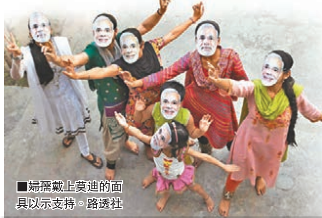
婦孺戴上莫迪的面具以示支持。

親商界的莫迪勝選，消息刺激印度股匯造好，Sensex指數昨一度抽升6%，首次升穿25,000點大關。自去年9月莫迪被提名總理候選人以來，印度股市市值至今攀升3,300億美元(約2.56萬億港元)。印度盧比匯率昨日曾創11個月新高。