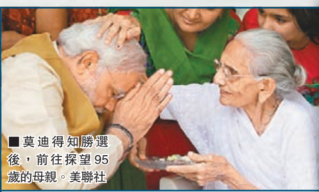
莫迪得知勝選後，前往探望95歲的母親。