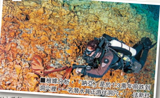
根據分析，「納亞」是於1.3萬年前跌到洞穴裡，一名潛水員正游往洞穴。

近乎完整的遺骸。科學家分析其骨骼和脫氧核糖核酸(DNA)後相信，最早的美洲人來自亞洲東北部，他們遷徙至連接西伯利亞與美洲的白令陸橋，過橋後到達