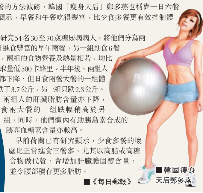
韓國瘦身天后鄭多燕

不少營養師建議以少食多餐的方法減磅，韓國「瘦身天后」鄭多燕也稱靠一日六餐瘦身。然而近日有研究顯示，早餐和午餐吃得豐富，比少食多餐更有效控制體重及血糖水平。 捷克研究團隊研究54名30至70歲糖尿病病人，將他們分為兩組，一組每日進食豐富的早午兩餐，另一組則食6餐但份量少，兩組的食物營養及熱量相若，均比建議攝取量低500卡路里。半年後，兩組人體重都下降，但日食兩餐大餐的一組體重重了3.7公斤，另一組只跌2.3公斤。 兩組人的肝臟脂肪含量亦下降，食兩大餐的一組跌幅稍高於另一組，同時，他們體內有助胰島素合成的胰高血糖素含量亦較高。 早前荷蘭已有研究顯示，少食多餐的壞處比正常進食三餐多，尤其以高脂或高糖食物做代餐，會增加肝臟膽固醇含量，並令腰部積存更多脂肪。