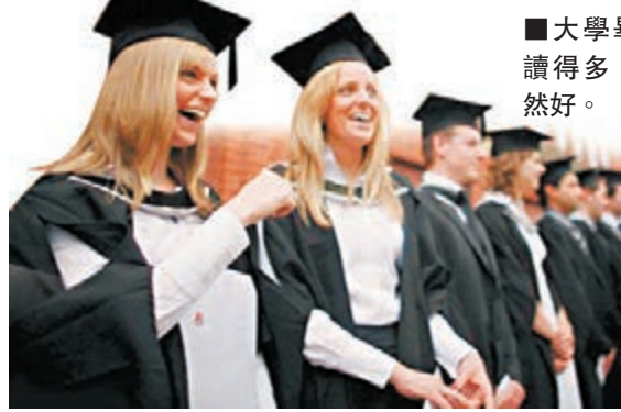
大學畢業生書讀得多，出路自然好。