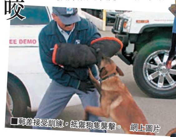
郵差接受訓練，抵禦狗隻襲擊。