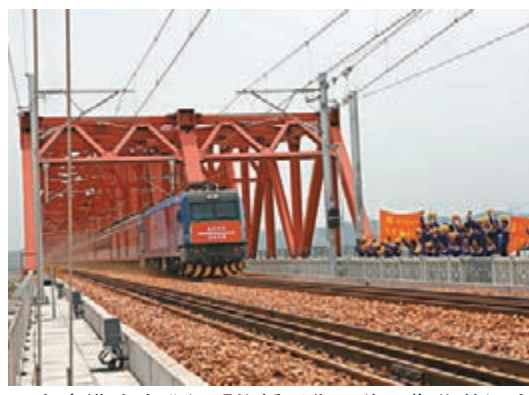
京廣鐵路昨進行「換橋手術」後，鄭焦黃河大橋京廣線正式通車。