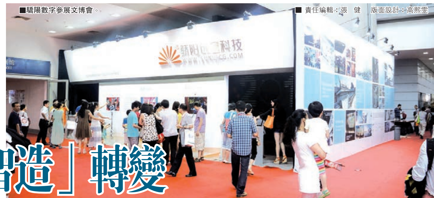
驕陽數字參展文博會。