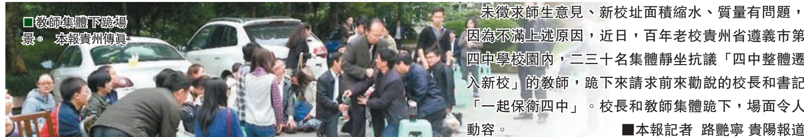
教師集體下跪場景。本報貴州傳真

另外,APEC貿易部長會議也將於17日在青島召開,外界一直認為在APEC框架內,APEC第二次高官會議與貿易部長會議是除領導人非正式會議以外最重要的會議。據悉,第三次高官會及相關會議將於8月6日至21日在北京舉行。今年領導人非正式會議以及其他各項活動將於11月5日至11日在北京舉行。