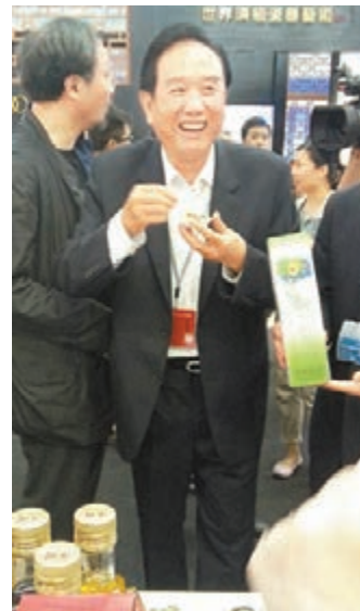
陳雲林參觀台灣館。

香港文匯報訊(記者李望賢、李薇 深圳報道)第十屆文博會昨日(15日)在深圳召開,共有83家台灣企業參展。海協會原會長、海協會顧問陳雲林出席文博會台灣館開幕禮。談到服貿協定在台灣引起的各種爭議,他指服貿協定對海峽兩岸都有利,相信受阻只是一個過程,最終能夠順利推行。