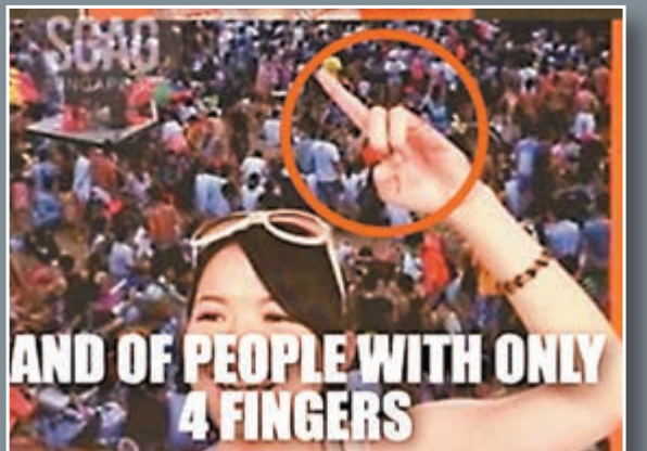
台觀光海報PS現四指人

與會會長表示,不僅台商關切,大陸對裕元事件也小心應對,因罷工的「全國效應」已經顯現,不只影響台商,也會影響到民企和國企。與會的大陸官員沒有拿出「標準答案」。國台辦負責官員表示,了解台商的現況,希望會長提供實際數據,供政策研擬依據。