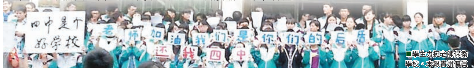
學生打標語送食品聲援學校。