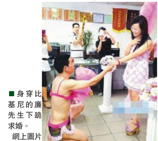
身穿比基尼的廉先生下跪求婚。

前日中午,廣東東莞樟木頭龍威花園前道路上,一名男子身穿女式比基尼、手捧鮮花,步行前往龍威花園,引起路人圍觀。原來,該男子是一名水電工,為了向「白富美」(形容皮膚好、經濟背景好、長得漂亮)女友求婚才穿奇裝