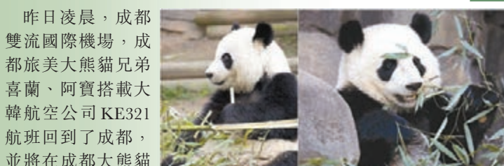
旅美歸國的大熊貓兄弟喜蘭(左)、阿寶(右)。本報四川傳真

昨日凌晨,成都雙流國際機場,成都旅美大熊貓兄弟喜蘭、阿寶搭載大韓航空公司KE321航班回到了成都,並將在成都大熊貓繁育研究基地定居,開始牠們新生活。