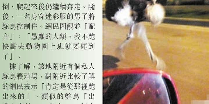
鴛鴦在北京大街上狂奔。

有網民近日發微博稱,在北京朝陽區,一隻鴛鴦在街上狂奔,並超越數輛汽車,引得路人紛紛圍觀。據稱,當時警方在後面追趕,防止鴛鴦影響交通。有網民表示,這隻狂奔的鴛鴦在奔跑中不幸被三輪車撞倒,爬起來後仍繼續奔走。隨後,一名身穿迷彩服的男子將鴛鴦控制住。網民圍觀並「配音」:「愚蠢的人類,我不跑快點去動物園上班就要遲到了」。