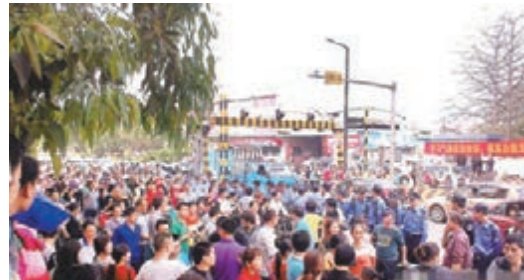
東莞裕元鞋廠員工此前因不滿公司少購社保,遊行抗議。網上圖片

香港文匯報訊 據《聯合報》報道,台商轉投資廣東東莞的裕元鞋廠,日前因社保問題引發工人罷工,來自各地的台商會長昨日在貴陽舉行的台企聯年會中討論激烈,希望國台辦及人社部拿出一套標準,方便台商執行。國台辦表示,已派兩組人分別在廣東東莞和江蘇昆山調研,並盼台商會長提供實際數據,供中央制訂政策參考。