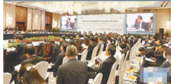
300多名代表出席APEC第二次高官會議。

香港文匯報訊(記者王宇軒 青島報道)2014亞太經合組織(APEC)第二次高官會議14日在山東省青島市舉行,來自21個亞太經合組織經濟體、秘書處、工商諮